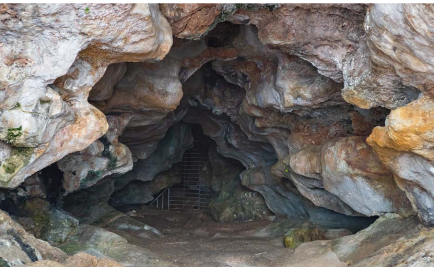
▼ Jaskinia Ghar Hasan