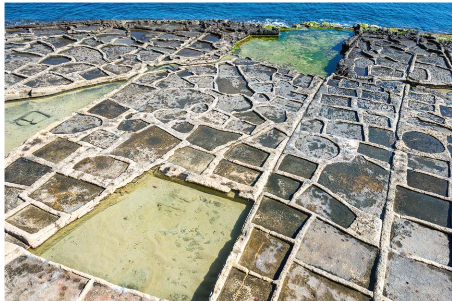
▼ Saliny – płaskie baseny, w których produkuje się sól z morskiej wody w okolicy Marsaskali

Marsaskala była spokojnym portowym miasteczkiem. Ludzie kupowali w tej okolicy letnie rezydencje, a ostatecznie przenieśli się na stałe. Wskutek tych przemian miejscowość stała się kurortem, w którym obecnie wznoszą się nowoczesne hotele. Jednak herb miasteczka oraz jego flaga wciąż przypominają o sielankowej przeszłości Marsaskali. Emblematem miasta są dwa zielone trójkąty, tworzące obraz przypominający stromą dolinę, między którymi umieszczono rysunek niebiesko-białych fal. Marsaskala leży bowiem w dolinie, a morze bardzo głęboko wcina się w ląd.