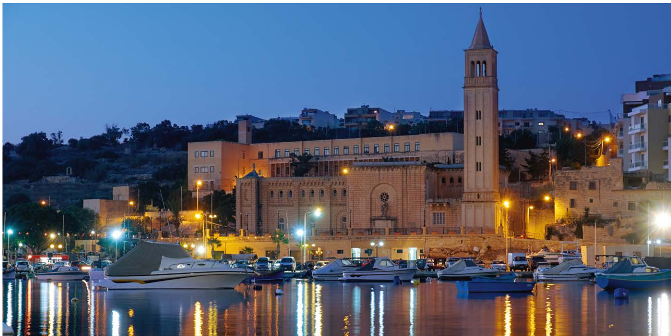
▲ Port w Marsaskali

W XIX w. zamieszkało na tym terenie nieco więcej osadników, być może za sprawą pojawiających się wiosną rzek. Stąd wzięła się nazwa Wied il-Ghajjn , używana przez miejscowych do dzisiaj. Oznacza ona