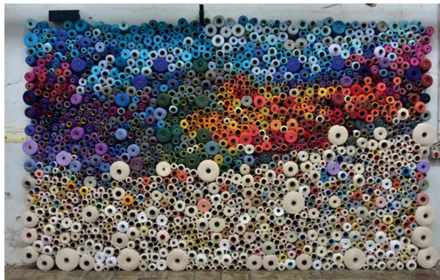
▲ Muzeum Lniarstwa

Kolejny monument, odwołujący się do robotniczej historii miasta, znajduje się przy ul. Nowy Świat – jest nim pomnik strajkującej przędzarki (protest miał miejsce w kwietniu 1883 r. i był spowodowany nierównościami płacowymi; w starciach zginęło trzech robotników). W pobliżu, na ścianie domu przy skrzyżowaniu ulic Okrzei i 1 Maja widnieje natomiast murale Solidarności , upamiętniający strajk żyrardowskich zakładów w 1981 r., przedstawiający protestujące robotnice.