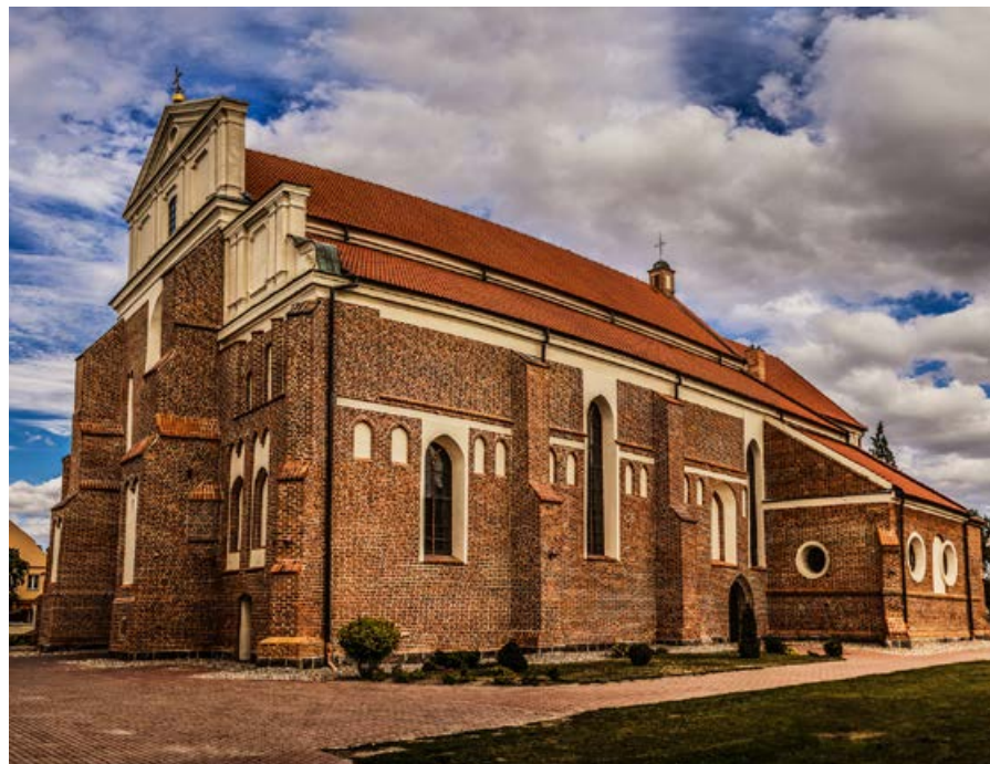
▲ Katedra św. Michała Archanioła

① www.muzeumdiecezjalne.lomza.pl ; ul. Giełczyńska 20a; tel.: 86 216 40 02; pn., śr. 11.00–18.00, wt., czw., pt. 9.00–15.00; wolne datki