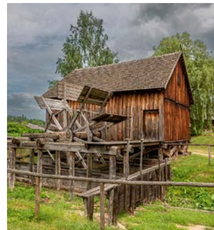
▲ Skansen w Nowogrodzie