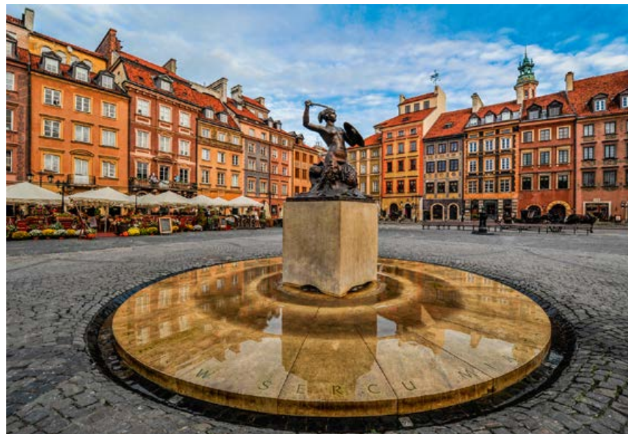
▲ Rynek Starego Miasta

Częścią muzeum są również krypty , gdzie znajdują się groby książąt mazowieckich, arcybiskupów warszawskich, a także Stanisława Augusta Poniatowskiego, prezydentów Gabriela Narutowicza i Ignacego Mościckiego,