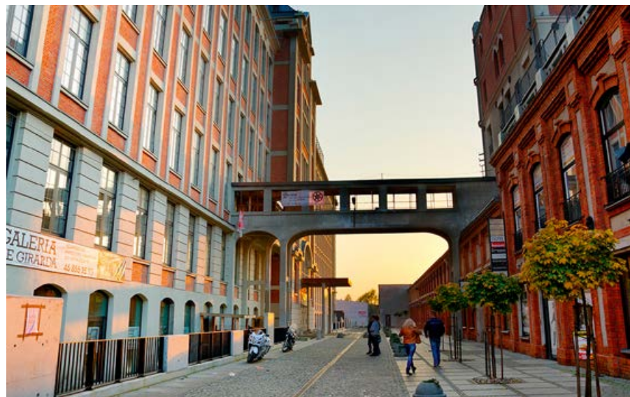
▲ Przemysłowa zabudowa Żyrardowa

Kościół jest jednym z największych na Mazowszu – jego kubatura wynosi 12 870 m 3 . Wewnątrz podziwiać można trzy bogato zdobione ołtarze, a także witraże z barwnymi kwiatami, m.in. makami, chabrami, słonecznikami i malwami. Szczególną uwagę warto zwrócić na witraż przedstawiający Matkę Boską z Dzieciątkiem, które w dłoni zamiast berła trzyma wrzeciono.