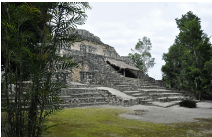
▲ Jedna z majańskich piramid na terenie Chacchoben