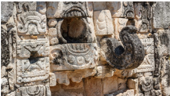
▲ Plaskorzeźby stiukowe w Mayapán

1,5-metrowy stiuk z grawerami czterech wojowników i ozdobami ptaków po obu stronach. W miejscu głów żołnierzy pozostawiono wielkie otwory. W dniach przesilenia letniego (noc z 21 na 22 czerwca) i zimowego (noc z 21 na 22 grudnia) na piramidzie zachodzą pewne zjawiska astronomiczne spowodowane usytuowaniem i konstrukcją budynku.