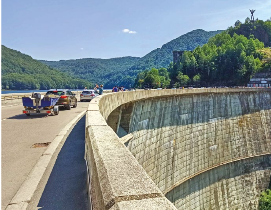
Zapora na rzece Ardeșez