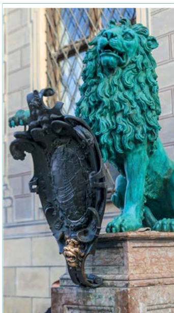
Pomnik bawarskiego Lwa przed Rezydencją

www.fcbayern.de/en – aktualności na temat Bayernu Monachium