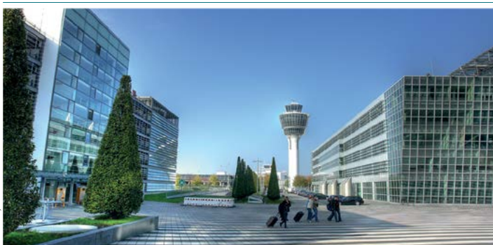
Międzynarodowy port lotniczy Munich International Airport

Zakazy wjazdu, skomplikowane zasady ruchu drogowego i problemy z zaparkowaniem sprawiają, że lepiej jest unikać jazdy samochodem po Monachium. Osoby zmotoryzowane powinny poszukać hotelu z parkingiem i zostawić tam pojazd na czas pobytu. Funkcjonujący program System Park & Ride umożliwia zatrzymanie auta czy motocykla na przedmieściach i poruszanie się środkami transportu publicznego. Informacje: www.mvv-muenchen.de .