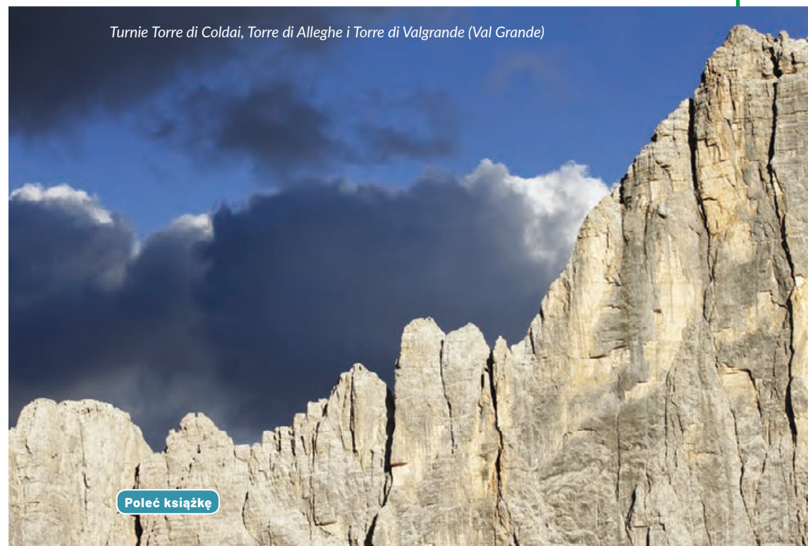
Turnie Torre di Coldai, Torre di Alleghe i Torre di Valgrande (Val Grande)