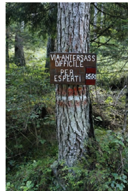
Drogowskaz początku szlaku Via Antersass

połogie płyty skalne, na których stalowa lina jest rzeczywiście przydatna tylko wtedy, gdy jest mokro. Docierając do małego, charakterystycznego kotła, pokonaj końcowy odcinek podejścia (stalowe liny nie są potrzebne), który wyprowadza na szlak Alta Via 1 i do wspaniałej doliny Val Civetta (2:30 h). Skręć w prawo. Kierując się drogowskazami schroniska Rifugio Tissi, podążaj ścieżką prowadzącą góra-dół, wśród gładów, przez dolinki, po łące, aż do skrzyżowania, od którego ścieżka wiodąca w prawo (na północny zachód) wznosi się do schroniska. Łatwym podejściem dotrzesz do budynku (2250 m, 3:30 h z Fontanive) położonego w rewelacyjnym