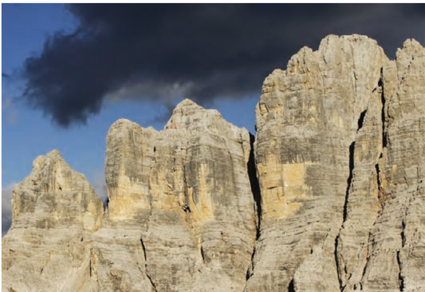
Skalna grań między turnią Torre di Valgrande a szczytem Punta Civetta