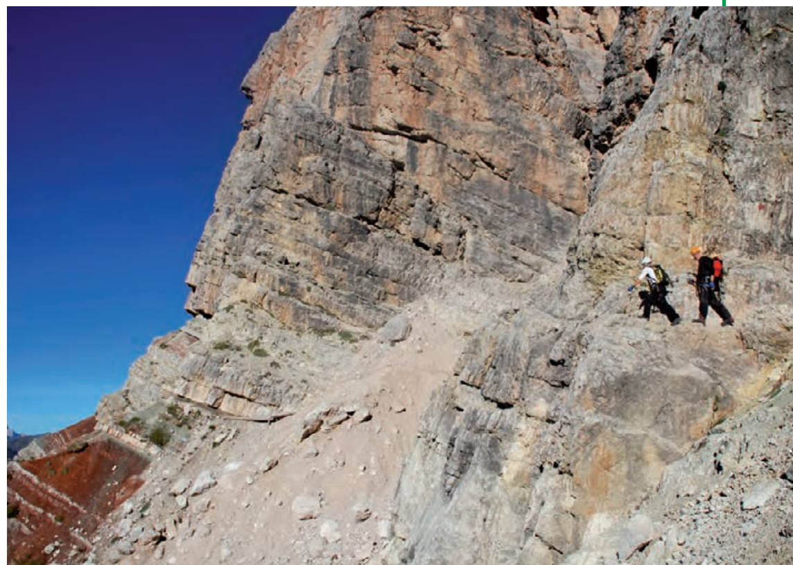
Przejście wśród kolorowych skał

Ze schroniska Rifugio Pomedes zejdz do Rifugio Dibona, kontynuując przejście ścieżką nr 421.