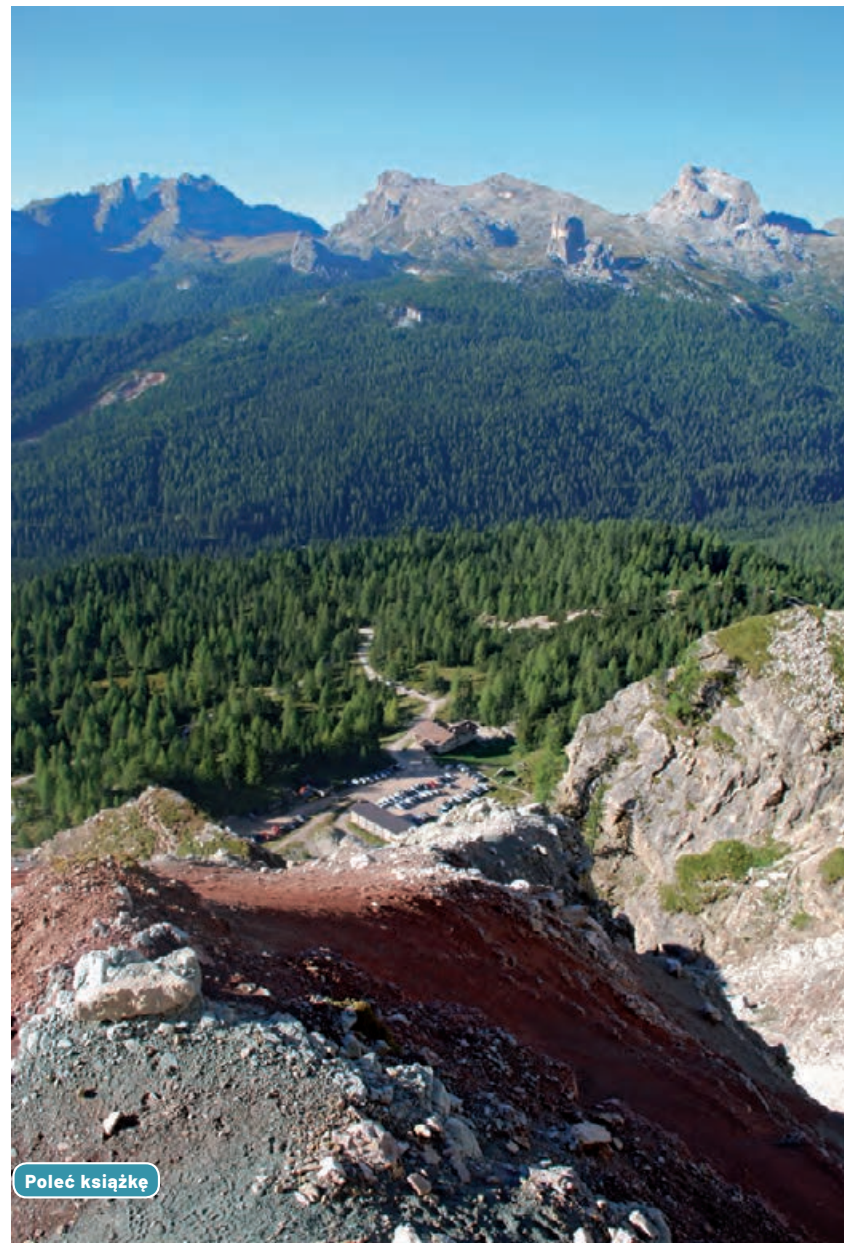
Widok z góry na schronisko Rifugio Dibona

Ten szlak można przejść również w kierunku przeciwnym do opisanego. Nie ma to wpływu na pokonywane trudności ani potrzebny czas.