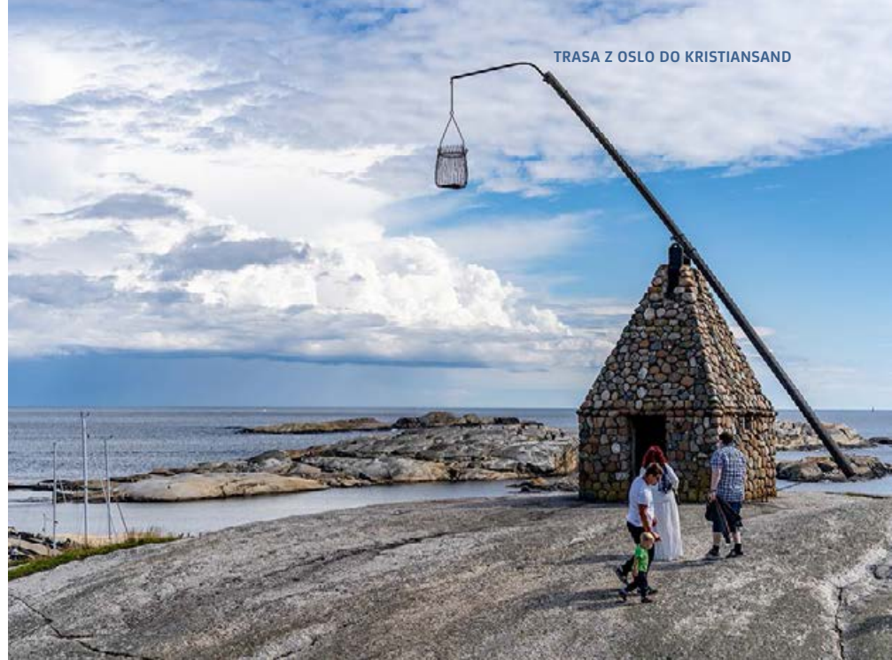
TRASA Z OSLO DO KRISTIANSAND