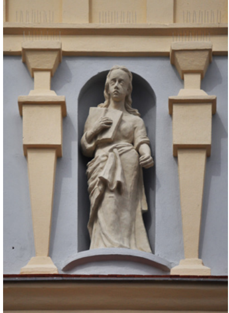
Alegoria Wiary (z Biblią)

Obecnie w budynku mieści się biblioteka.