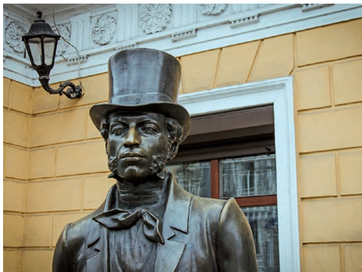
▲ Pomnik Aleksandra Puszkina

Zachodu i Wschodu 📍 ul. Puszkinińska 9; codz. oprócz śr. 10.30–17.30; 40 UAH, jednego z najciekawszych na całej Ukrainie. Budynek ukończony w 1856 r. gości muzeum od 1920 r., a w jego zbiorach, jak sugeruje nazwa, znajdziemy zarówno dzieła zachodnioeuropejskich, jak i orientalnych artystów. Guardi, Caravaggio, Hals – to tylko kilka przykładowych nazwisk. Stała ekspozycja pochodzi z prywatnych kolekcji, a także ze zbiorów Uniwersytetu w Odessie oraz muzeów w Kijowie i Moskwie. Oprócz obrazów muzeum zgromadziło pokaźną liczbę rzeźb, mebli i artefaktów z Dalekiego Wschodu (z Tybetu, Japonii, Chin). Za prawdziwe białe kruki należy uznać portrety św. Mateusza i Łukasza z cyklu Halsa poświęconego ewangelistom, a także Pojmanie Chrystusa Caravaggia. Ten ostatni obraz w 2008 r. został skradziony i dopiero po dwóch latach odnaleziono go w Berlinie. Biało-niebieski