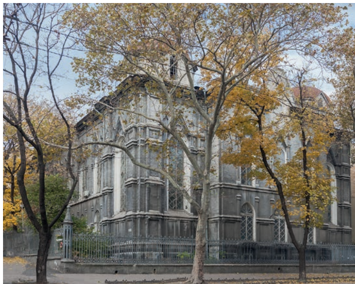
▲ Synagoga Brodzka

opiera się na betonowej podstawie imitującej granit, a fasady wykonano z terakoty w kilku odcieniach. Wnęki okienne są bogato zdobione detalami z białego marmuru karraryjskiego, które szczególnie okazale prezentują się wieczorem, podświetlone od wewnątrz. Filharmonia została gruntownie odrestaurowana w 1961 r., dobudowano wówczas także marmurowe schody prowadzące z holu wejściowego do sali głównej. Po obydwu ich stronach gości witają kolumny pełniące również funkcję lamp. Na lewo od wejścia, w niewielkiej niszy znajduje się popiersie Bernardazziego umieszczone tu w 1900 r. i upamiętniające 50. rocznicę rozpoczęcia przez architekta pracy zawodowej. Błękitny sufit z malowidłami przedstawiającymi znaki zodiaku ma przywodzić na myśl sklepienie niebieskie.