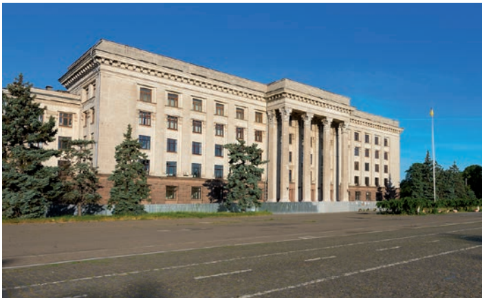
▲ Kulikowe Pole

Ostatnim punktem na naszej trasie jest monaster św. Michała Archaniola znajdujący się w pobliżu parku Szewczenki, do którego doprowadzą nas spod teatru ulice Leontowicza i Uspienska. Jest to prawosławny żeński klasztor wybudowany w 1840 r., założony przez Michaiła Woroncowa. Na przestrzeni prawie 180 lat funkcjonował także jako refektarz dla ubogich, szpital i dom dla sierot. Po rewolucji przez długie lata był zamknięty, w czasie okupacji przywrócono jego działanie, ale funkcjonował tylko do 1961 r. Odbudowę zrujnowanego budynku rozpoczęto dopiero w 1992 r., jednak po latach udało się doprowadzić świątynię do pierwotnego stanu i dziś możemy podziwiać mozaiki na jej fasadach i odnowione kopuły.