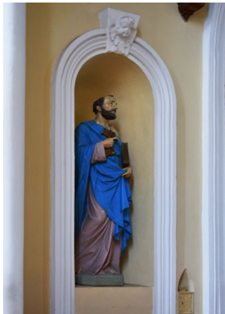
Figura św. Piotra

W nawie głównej jest sklepienie gwiaździste, w bocznych – krzyżowo-żebrowe.