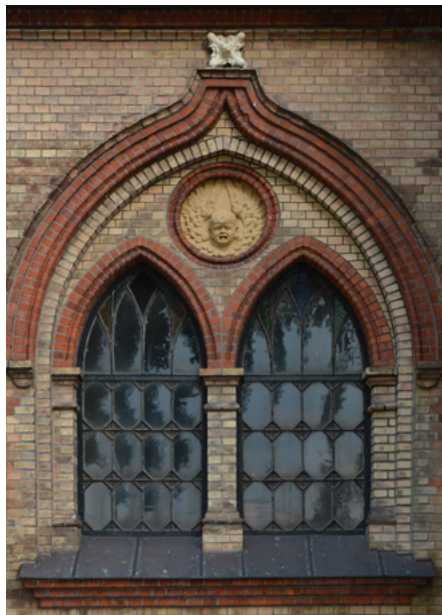
Okna w kruchcie (biforia), elewacja zachodnia