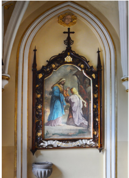
Obraz Matki Boskiej w kruchcie