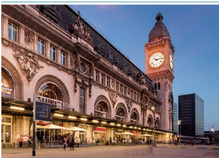
Gare de Lyon

Podróż samochodem to dosyć wygodny sposób na dojazd do Paryża, i tani, jeśli na benzynę składa się kilka osób.