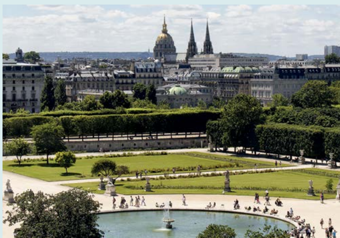
Jardin des Tuileries

Warto przysiąść na jednym z krzeseł rozstawionych naprzeciwko ośmiobocznej sadzawki w Jardin des Tuileries i rozkoszować się widokiem: perspektywą placu Zgody, Pól Elizejskich i dzielnicy La Défense z jednej strony, a ogrodów Tuileries i Luwru z drugiej. (Zob. s. 122).