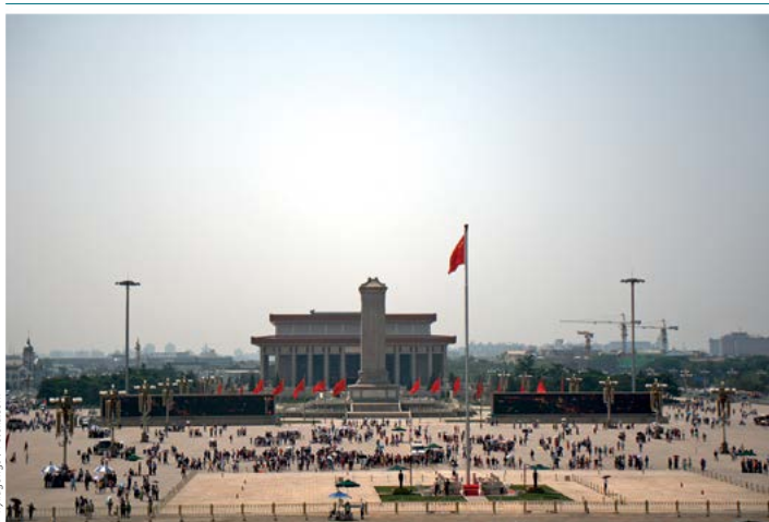
Plac Tian'anmen, w tle Mauzoleum Mao Zedonga

Obelisk o wysokości 38 m wzniesiono w 1958 r. po północnej stronie Mauzoleum Mao Zedonga. Zdobiące go płaskorzeźby ilustrują momenty ważne dla rewolucji ludowej, począwszy od wojen opiumowych. Straż pełnią przy nim żołnierze, w związku z czym nie sposób podejść do samego obelisku – można go tylko obejść.