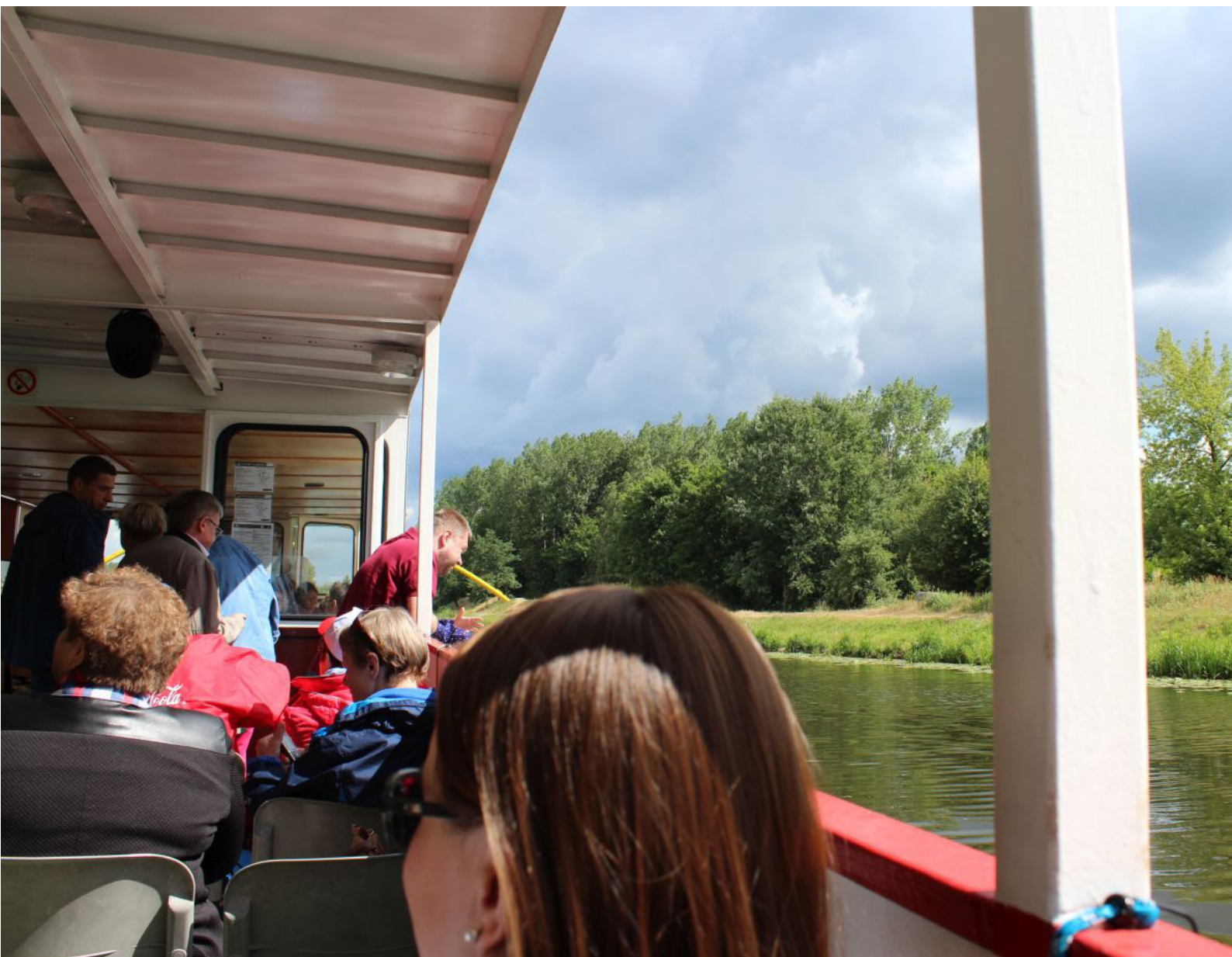
Fot.5. Podczas pierwszego rejsu było bardziej słoneczniej niż za drugim razem

Obserwowałem towarzyszy podróży i choć teraz nie było tak dużo dzieci jak ostatni razem, przez to było spokojniej, to część osób prowadziła ożywione dyskusje. Była grupka, która siedziała dwa stoły dalej i miałem wrażenie, że w ogóle ich nie interesuje co się dzieje po obu stronach burty. Ale byli też wycieczkowicze, którzy co chwila robili zdjęcia.