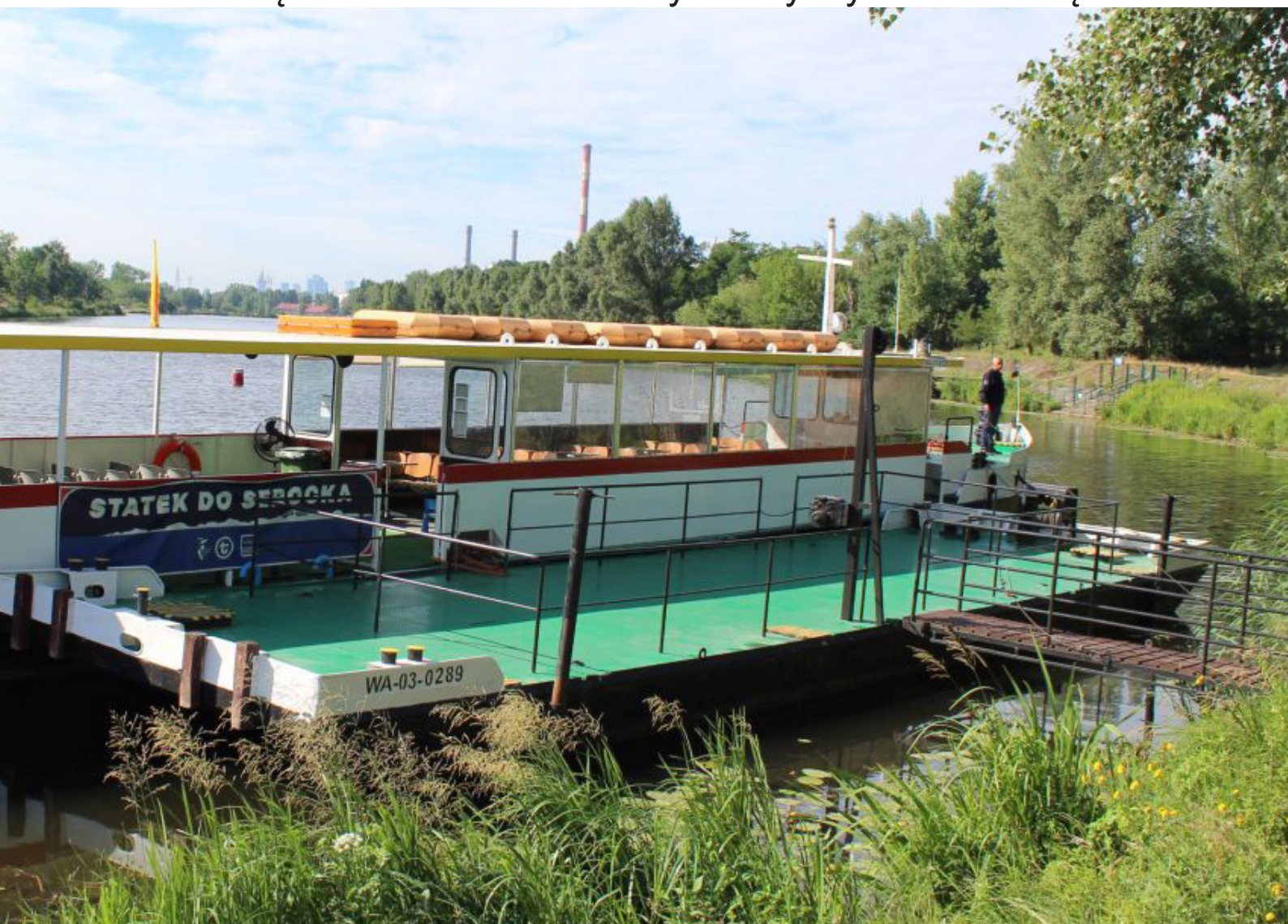
Fot.2. „Zefir” sprawia wrażenie bardzo stabilnego, ale na wszelki wypadek na górze możemy dostrzec szalupy ratunkowe

Na Zefirze pokład składał się z dwóch części: jedna „oszkłona” z plastikowego przezroczystego pleksiglasu i druga w pełni otwarta tzn. nie było tam, żadnych okien tylko metalowe framugi. Statek był zadaszony, ale w przypadku zacinającego deszczu czy wiatru w części bez okien trzeba było liczyć tylko na kurtkę.