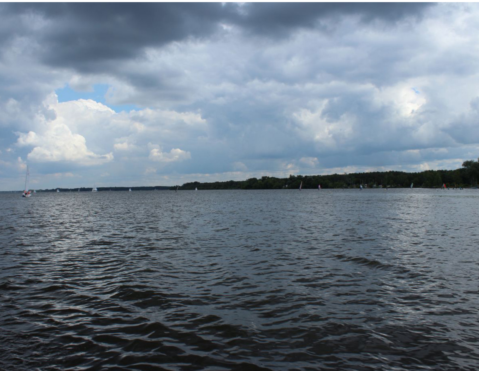
Fot.6. Pomimo tego, że zerwał się wiatr i pojawiły się fale „Zefir” ani drgnął może zatem jego nazwa ma wprowadzić w błąd?

Rejs po kanale niewątpliwie jest czymś innym niż spotkanie w pubie, ogródku piwnym czy nawet na grillu. Pomimo tego, że płynie się statkiem to nie trzeba cały czas siedzieć. W dowolnym momencie można wstać, przejść się i rozprostować kości. Na „Zefirze” jest mini kuchnia, gdzie można zjeść kielbasę na gorąco z musztardą i ogórkiem. Jest też kawa i herbata, ale warto zabrać coś do przegryzienia. Gdyż apetyt dopisuje. Na statku jest też toaleta więc nic nieprzewidzianego nie powinno nam zakłócić rejsu. O ile droga po kanale może wydawać się nużąca to moment wpłynięcia na Zalew Zegrzyński robi wrażenie. Kiedy wypływa się na tak wielki akwen to zmienia się perspektywa, tym bardziej, że są tam inne statki, sporo żaglówek i innych jednostek pływających.