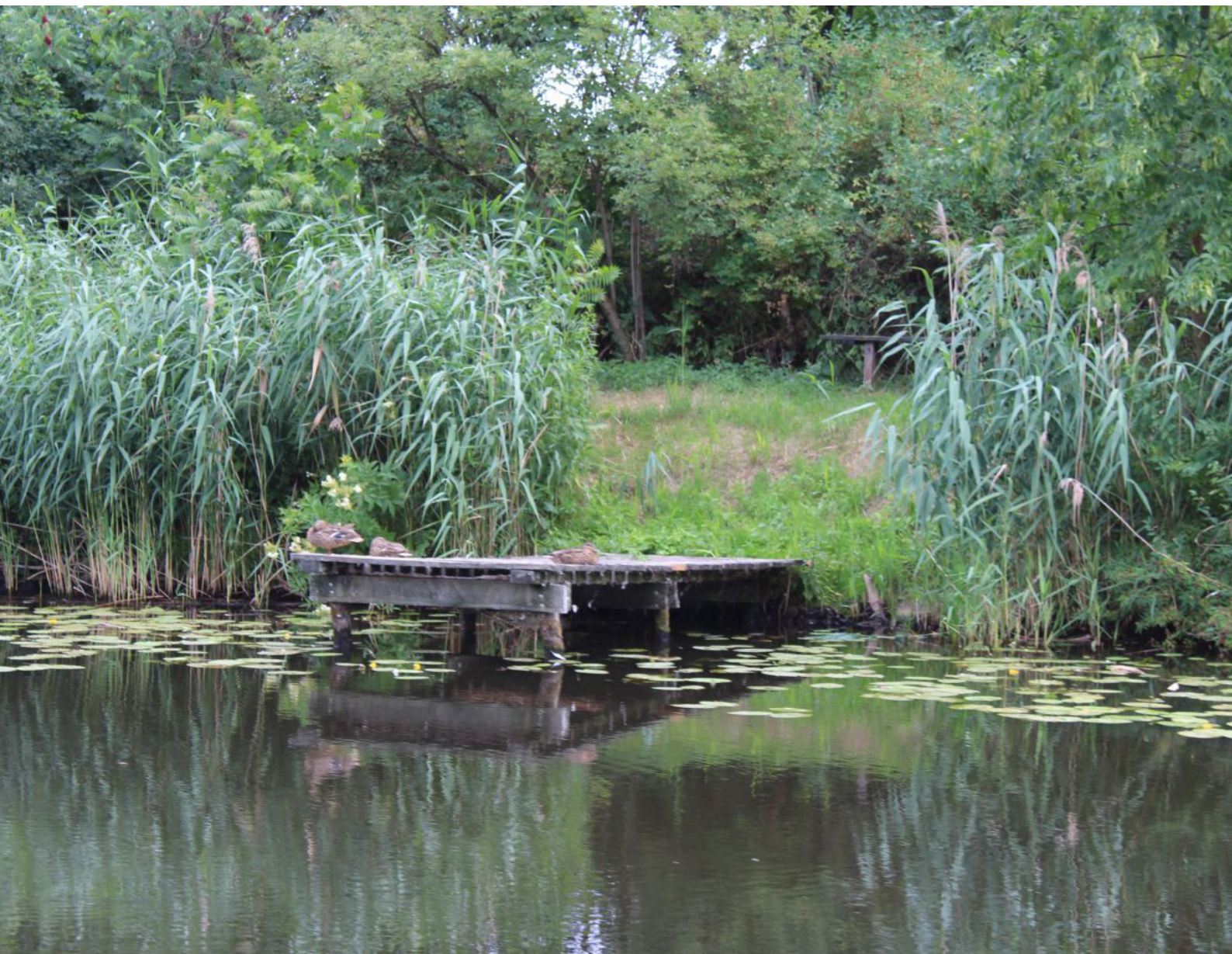
Fot.3. Tym razem małe stadko przycupnęło na drewnianym pomoście

W sumie za pierwszym razem płynąc sam i za drugim razem z mamą trafiłem na idealną pogodę, gdyż nie było ani za zimno ani za gorąco. Co chwila mijaliśmy stadka krzyżówek. Jak widać te popularne ptaki upodobały sobie rzeki naszym kraju i gdziekolwiek jestem na jakimś szlaku wodnym zawsze mi towarzyszą, albo wszystkie w maskujących szarych barwach albo ładnie ubarwione samce w okresie godowym.