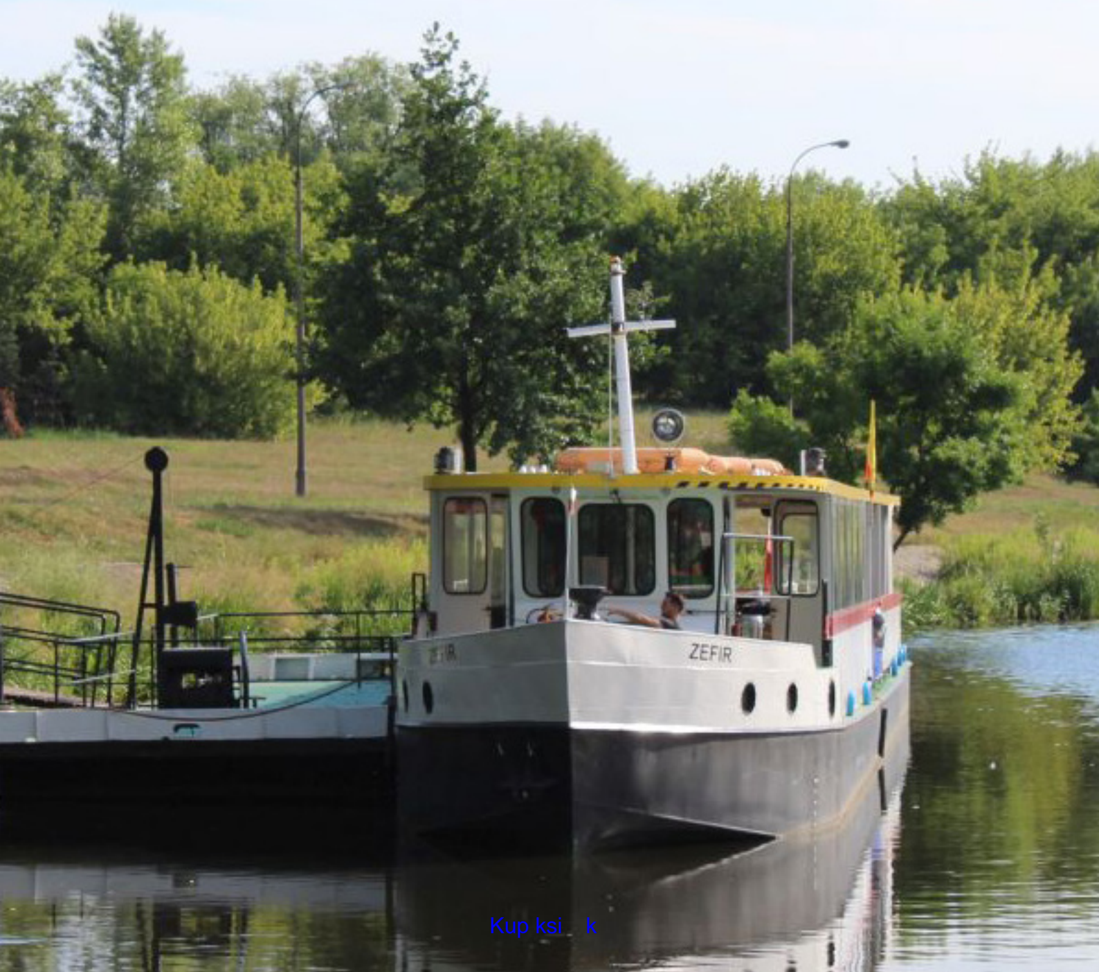
Fot.1. „Zefir” w oczekiwaniu na pasażerów