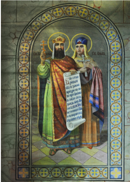
Św. Włodzimierz i św. Olga

W cerkwi zachowała się w bardzo dobrym stanie polichromia figuralna i ornamentalna, z 1937 r.