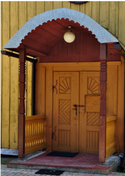
Wejście do kruchty (elewacja zachodnia)