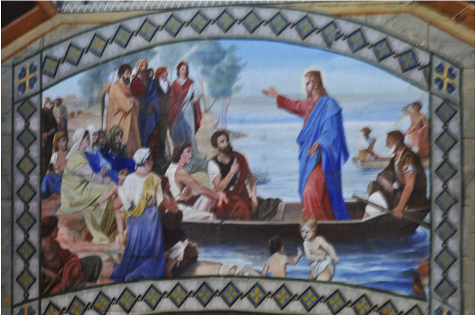
Dekoracje tambura – sceny z życia Chrystusa

Polichromie figuratywne nawiązują do tradycji cerkiewnej, ale też do malarstwa zachodnioeuropejskiego.