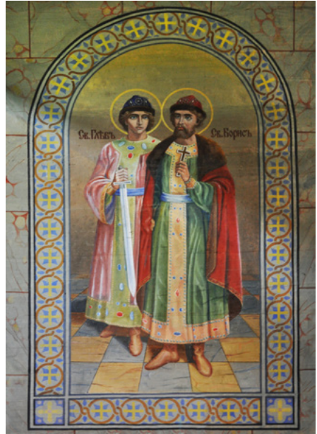
Św. Gawrył i św. Borys