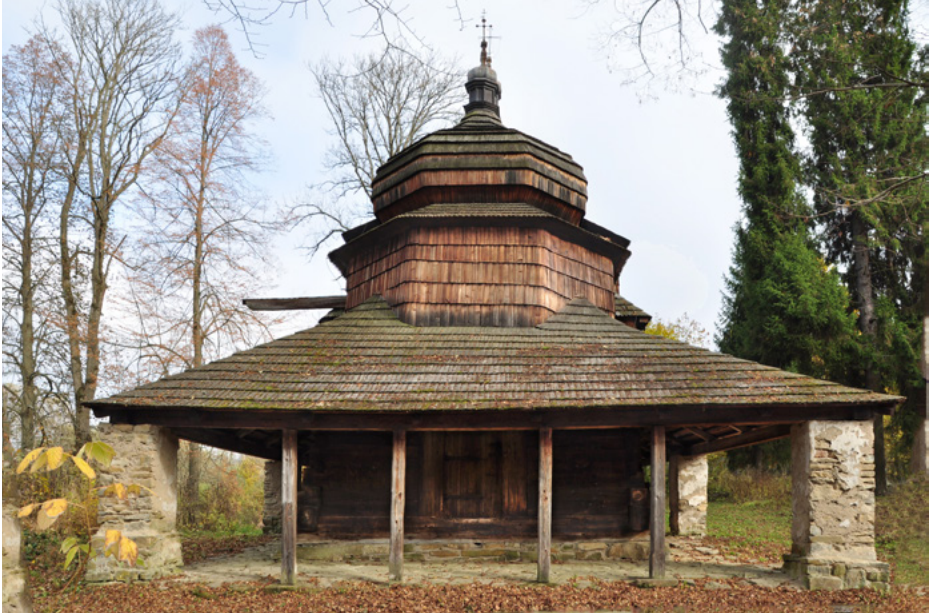
Elewacja zachodnia, opasanie nad wejściem

Cerkiew św. Dymitra jest filią Muzeum Budownictwa Ludowego w Sanoku.