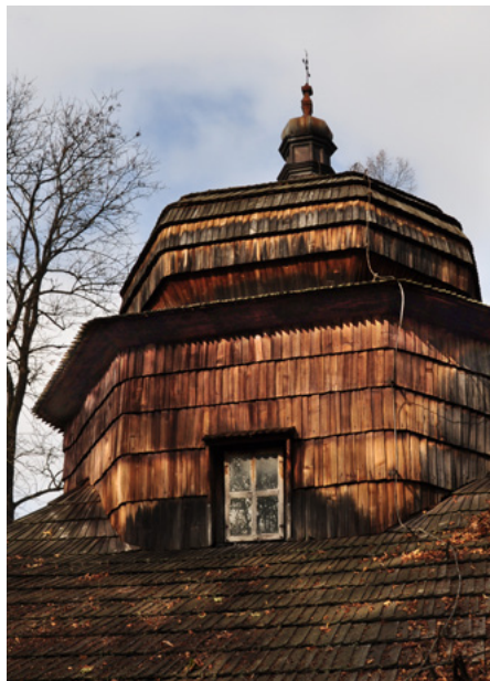
Kopuła nad kruchtą, elewacja południowa

Nawa jest większa od babińca i prezbiterium. Wszystkie części mają płaskie stropy. Chór znajduje się w nawie, od zachodu.