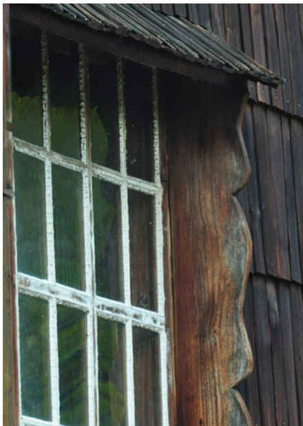
Okno w nawie, elewacja południowa

Pozorna latarnia i krzyż nad kopułą kruchtę (fot. z lewej) i nawy (fot. z prawej)