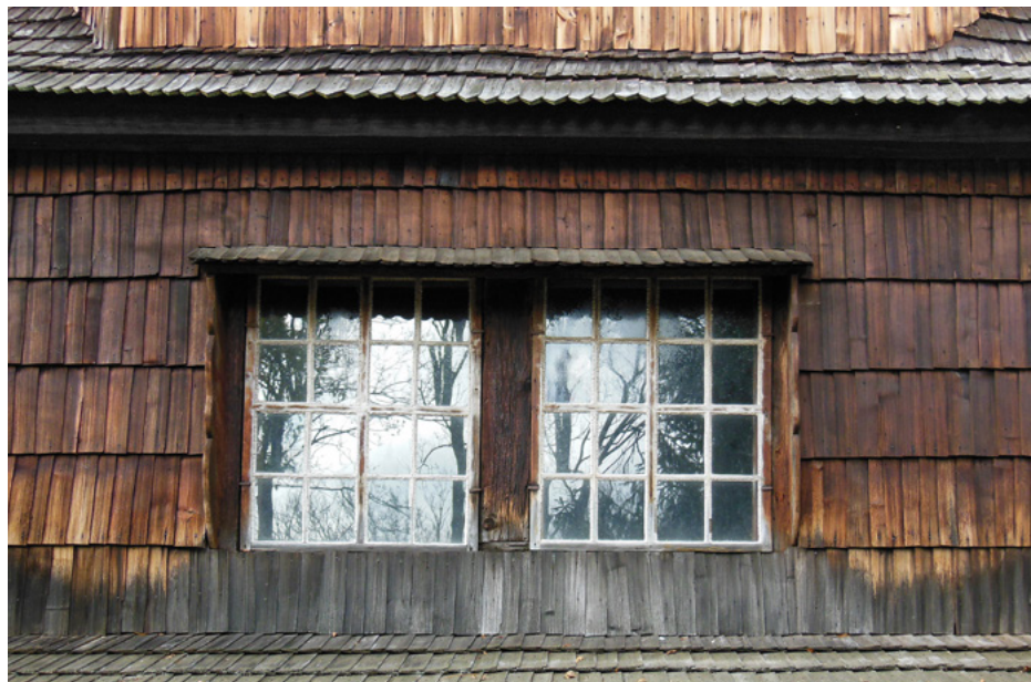
Elewacja południowa, nawa

Należy do nielicznych na terenie południowo-wschodniej Polski trójdzielnych cerkwi kopułowych.