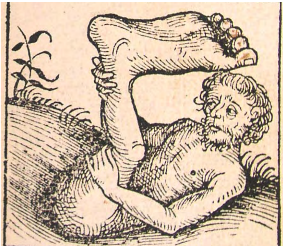
„Monopod”, czyli „Jednonóg” ( Kronika Norymberska , Norymberga 1493).

Mongołów Chorezmu, przez którą wędrowali wzdłuż doliny rzeki Syrdarii. Potem dotarli na tereny góryste, ciągnące się wzdłuż północnych stoków gór Tienszan, skąd przez Dżungarię przedostali się na Wyżynę Mongolską. Po kolejnych tygodniach jazdy, 22 lipca franciszkanie przybyli do Ormektui nad rzeką Orchon.