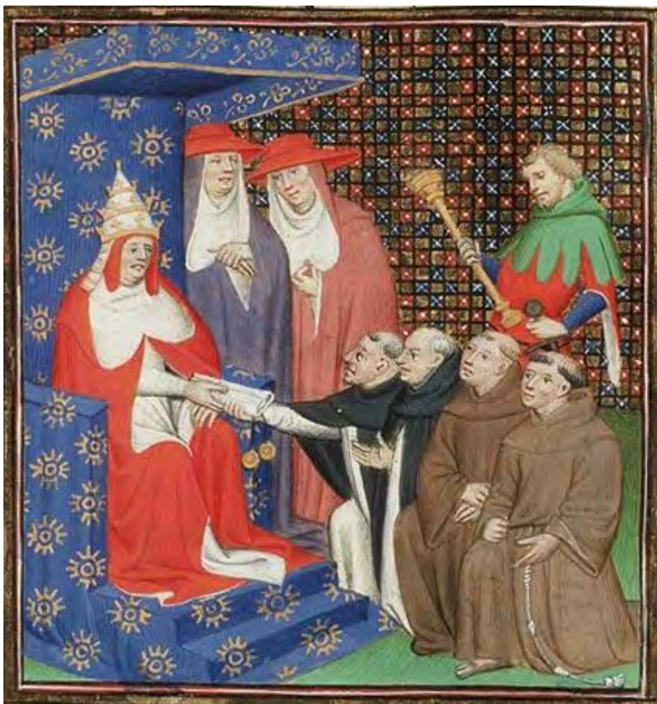
Papież Innocenty IV wysłał dwóch dominikanów i dwóch franciszkanów do Mongołów (iluminacja autorstwa Mistrza Cité des Dames do dzieła Wincentego z Beauvais Le Miroir Historial , t. IV, ok. 1400-1410).

Włocha, do wyprawy dołączył w charakterze tłumacza (prawdopodobnie języka polskiego i ruskiego) franciszkanin Benedykt Polak (ok. 1200–ok. 1280), o którego wcześniejszych losach właściwie nic nie wiadomo.