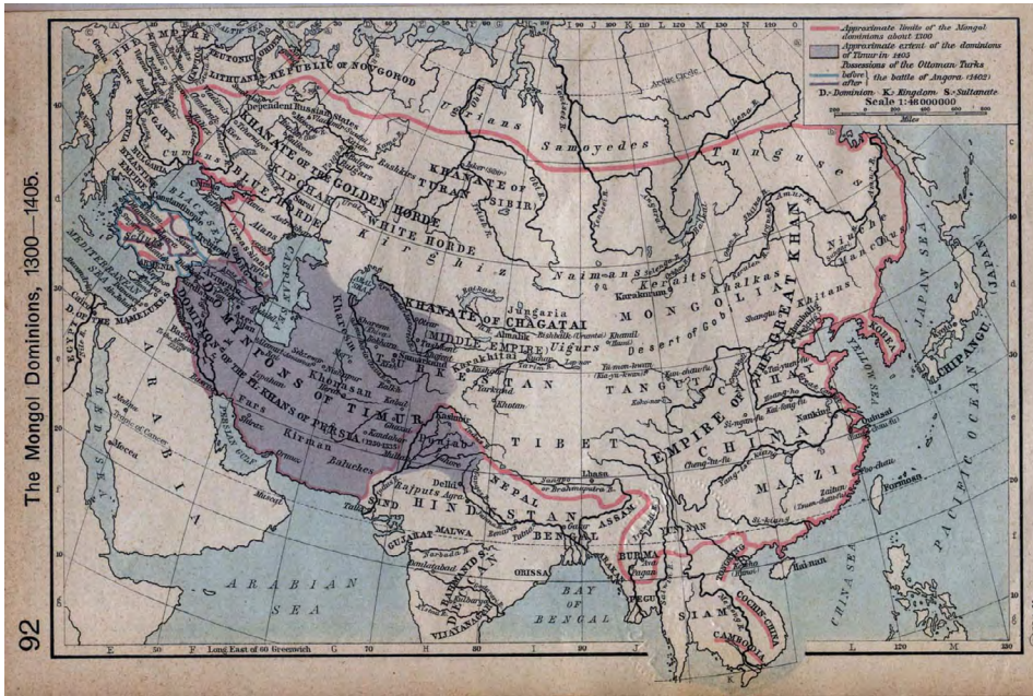
Mapa Imperium Mongolskiego w granicach z około 1300 roku, z oznaczonymi państwami sukcesyjnymi (William R. Shepherd, Historical Atlas , Nowy Jork 1923).

W drugiej połowie XIII i na początku XIV wieku Mongołowie jeszcze parokrotnie najeżdżali Europę, m.in. Litwę, Bałkany i Węgry, czyniąc wielkie spustoszenia. Ziemie polskie łupili w tym okresie dwukrotnie – w latach 1259–1260 i 1287–1288. Imperium Mongołów, które w szczytowym momencie obejmowało ok. 33 mln km 2 (podbilo jeszcze m.in. północną Birnę i południowe Chiny), zaczęło słabnąć pod koniec XIII wieku. W XIV wieku utraciło wiele z podbitych wcześniej ziem (Ruś, Chiny) i rozpadło się na mniejsze państwa, które z czasem również pozanikały.