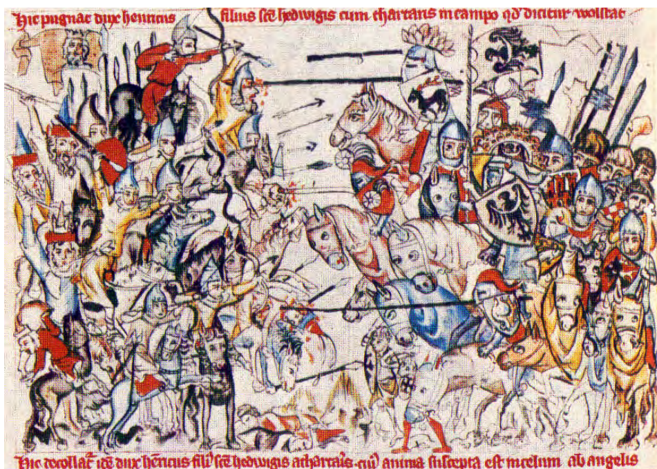
Bitwa pod Legnicą ( Legenda o świętej Jadwidze , 1353).

sukcesji w imperium. Nowsze badania jako przyczyny przerwania ofensywy pogan uznają m.in. nieprzyjazną dla Mongołów śnieżną zimę i deszczową wiosnę na początku 1242 roku (które zamieniły ogromne obszary Węgier w tereny bagniste), duże zaludnienie i silne ufortyfikowanie miast i zamków Europy Zachodniej, a nawet brak planów dalszej ekspansji na ten moment.