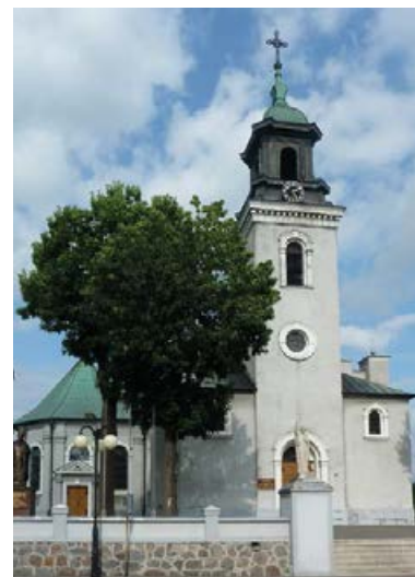
✦ Kościół św. Mikołaja

W samym centrum niewielkiego Witkowa stoi murowany kościół św. Mikołaja zbudowany ok. 1840 r. W świątyni przechowywane są zabytkowe kielichy, w tym jeden XVII-wieczny, oraz późnobarokowa monstrancja. Niedaleko świątyni znajdują się pomnik Powstańców Wielkopolskich i dwa pomniki-samoloty.