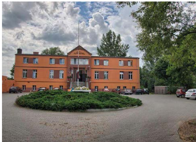
↗ Dwór w Skubarczewie

Rano ruszamy w dalszą trasę. Drogą między dwiema częściami jeziora wjeżdżamy na cypel Ostrowo lub inaczej Półwysep Ostrowski. Wieś Ostrowo znajduje się na terenie Powidzkiego Parku