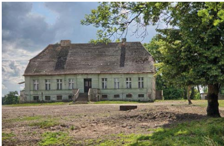
↗ Dwór w Skorzęcinie

Kierując się al. Handlową na południowy wschód i dalej al. Dębową, dotrzemy do Słowikowa nad Jeziorem Słowikowskim. Znajduje się tu zabytkowy park z XIX w., w którym rosną pomniki przyrody, m.in. dęby z pniami o obwodzie ponad 400 cm. Zobaczymy tu też Skansen nad Potokiem , czyli znajdujące się przy tutejszej szkole niewielkie muzeum maszyn rolniczych.