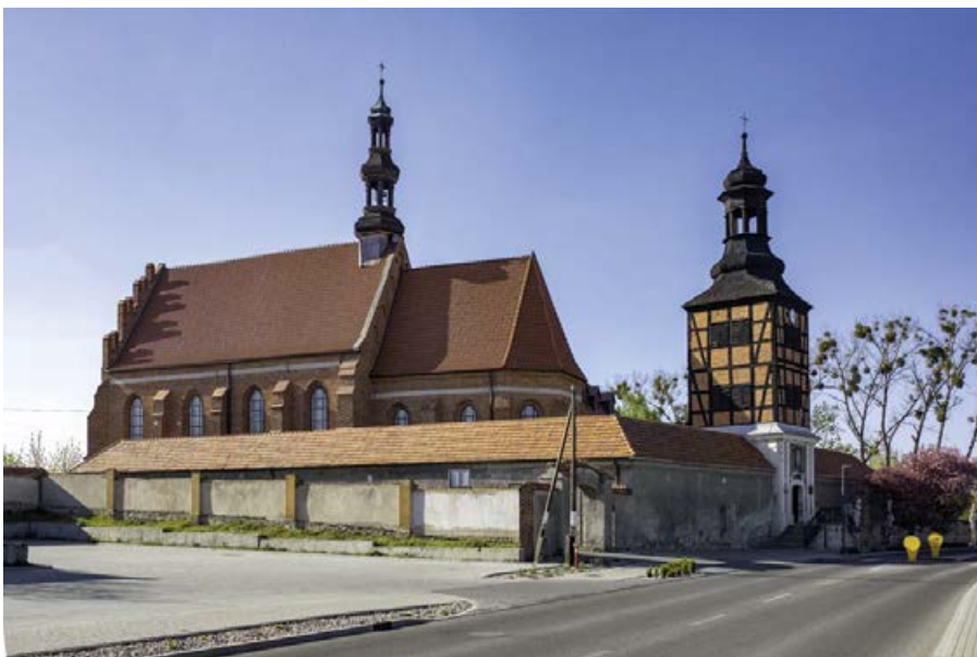
✦ Kościół św. Marcina w Kazimierzu Biskupim