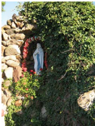
↗ Grota NMP z Lourdes w Kamionce

Około 1,2 km dalej, na rozstaju dróg kierujemy się w lewo do Skorzęcina. Zanim to zrobimy, spójrzmy jeszcze na drewniany wiatrak koźlak z XIX w.