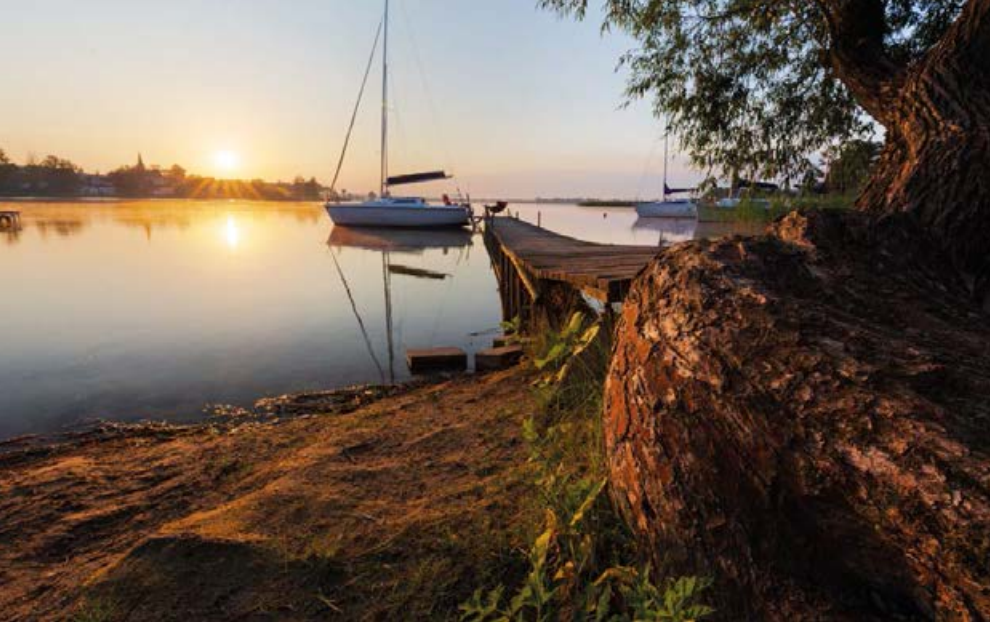
⤴ Jezioro Powidzkie

Krajobrazowego. Można stąd podziwiać piękne widoki na jezioro i lasy.