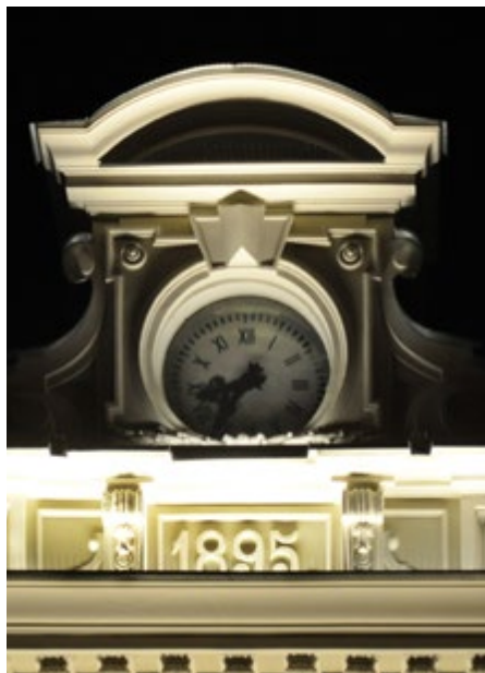
Zegar nad halą główną

Dworzec gościł m. in. cesarza Franciszka Józefa I, cara Rosji Mikołaja II, królów Rumunii – Ferdynanda I i Karola II.