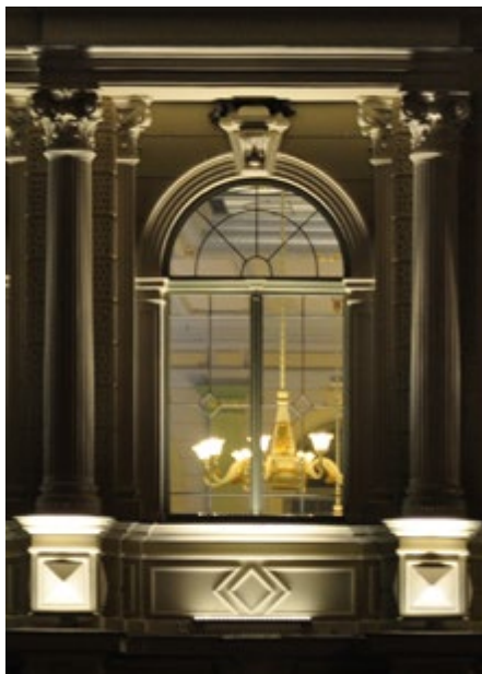
Okno hali głównej