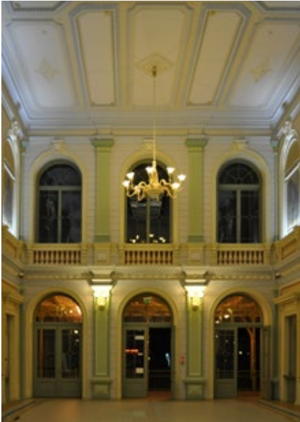
Hala główna, ściana północna