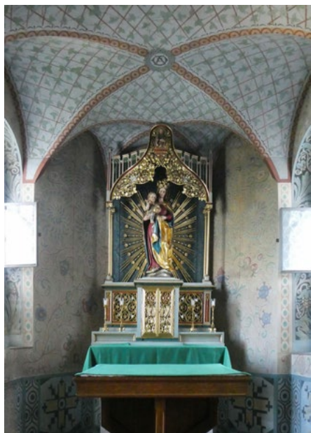
Absyda (prezbiterium), ołtarz z figurą Matki Boskiej

Wystrój wnętrza pochodzi z lat 1916–1917. W neogotyckim ołtarzu głównym jest figura Matki Boskiej, a w nawie Anioła Stróża z dzieckiem (z lewej) i Józefa z Dzieciątkiem (z prawej).