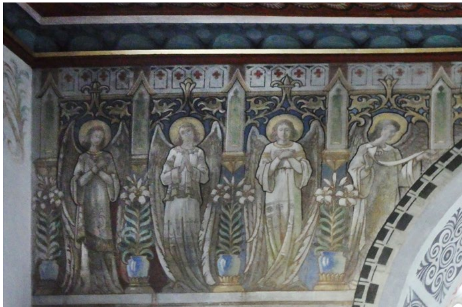
Polichromia na łuku tęczowym