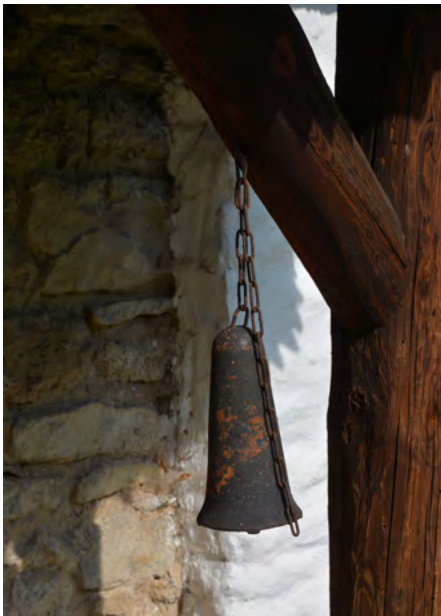
Dzwonek przy murze wschodnim

Dzwonnica – konstrukcji słupowo-ramowej, z galerią w górnej kondygnacji – pochodzi z XVI w.