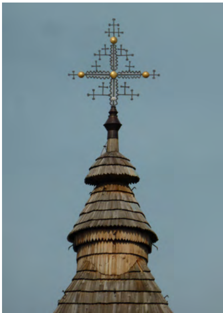
Gontowa latarnia nad nawą