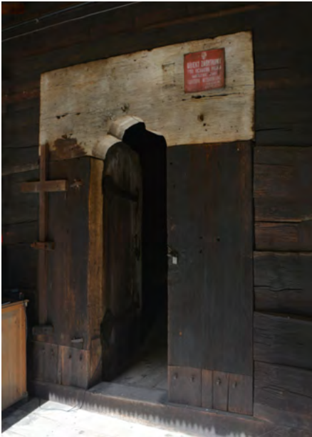
Wejście do kruchty (elewacja zachodnia)