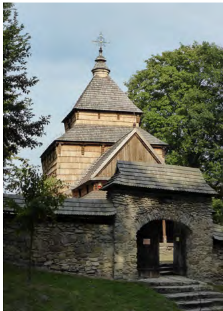
Brama i mur od strony zachodniej

Być może miała charakter obronny, ale kamienny mur z bramami, zwieńczony gontowym daszkiem, powstał dopiero w 1825 r.