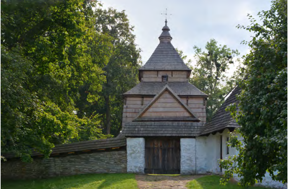
Mur; z prawej kostnica (dom diaka)

Od wschodniej strony muru w 2. poł. XIX w. zbudowano kostnicę (tzw. dom diaka), z kamienia wapiennego (fot. z prawej).