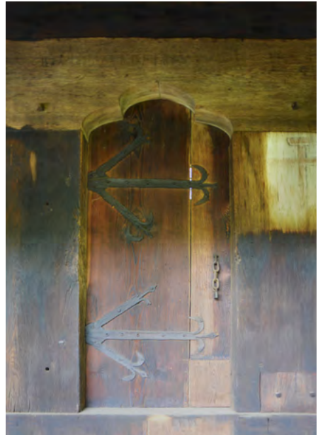
Wejście boczne do nawy (elewacja południowa)

Dzwonnica – konstrukcji słupowo-ramowej, z galerią w górnej kondygnacji – pochodzi z XVI w.