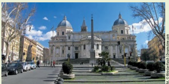
► Bazylika św. Marii Większej