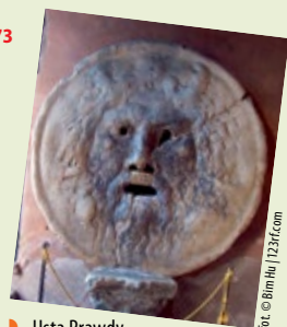
► Usta Prawdy

Ciekawy, wczesnochrześcijański kościół odwiedzany przez turystów przede wszystkim ze względu na znajdujące się w jego przedsionku Usta Prawdy (Bocca della Verità) – kamienną tarczę przedstawiającą rzymskiego boga rzek, która, jak głosi legenda, każdemu kto skłamię włożywszy rękę do ust bożka, odgryzie dłoń.