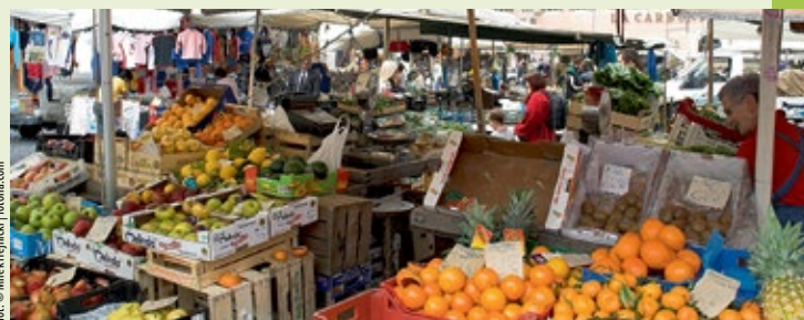
► Plac handlowy kiedyś był miejscem egzekucji Giordana Bruna