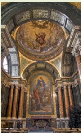
► Wnętrze kościoła Santa Maria del Popolo

Świątynia położona na wzgórzu Celius jest jednym z ciekawszych rzymskich palimpsestów. Warstwami nakładają się na siebie budowle z kolejnych epok, począwszy od rzymskiego mitreum i domus z II w. n.e., poprzez chrześcijańskie świątynie z IV i XII w. n.e., aż do barokowych struktur.