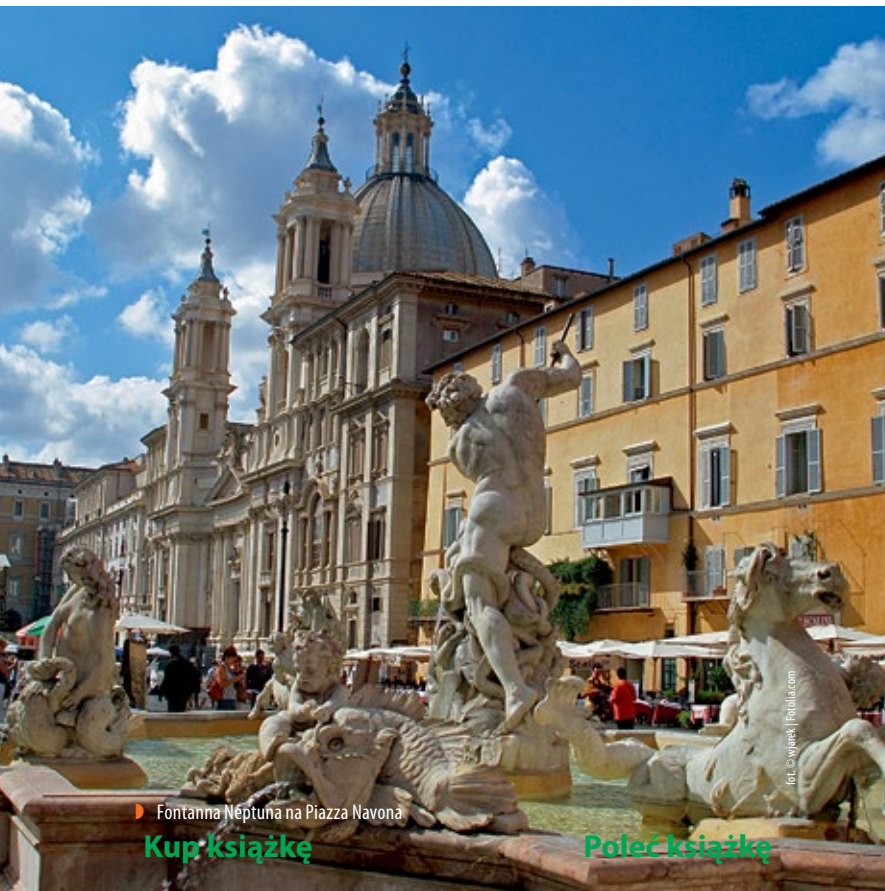
▶ Fontanna Neptuna na Piazza Navona

Rzym jest bardzo rozległym miastem i trzeba dobrze przygotować plan zwiedzania, by nie pominąć najważniejszych zabytków – zwłaszcza gdy zamierza się tu spędzić niewiele czasu. Osoby pragnące zostać dłużej w Wiecznym Mieście będą mogły zobaczyć naprawdę wiele atrakcji. Oprócz miejsc „obowiązkowych”, takich jak Koloseum czy Fontanna di Trevi, warto zwiedzić muzea, które są pełne prawdziwych skarbów sztuki (m. in. Galleria Borghese). Spacer po niezwykle urokliwych dzielnicach miasta, takich jak Testaccio będzie idealnym czasem relaksu i zadumy. Warto odpocząć nad Tybrem bądź w jednym z rzymskich parków zwanych „villami”, czy zjeść przepyszne lody, podziwiając panoramę Wiecznego Miasta ze wzgórza Gianicolo. Zawsze warto jednak rozpocząć podróż od ścisłego centrum Rzymu, które oszałamia liczbą i ogromem zabytków.