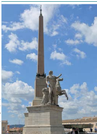
Obelisk na Kwirynale

Rzym liczy niemal 3 mln mieszkańców, czyli ponad połowę populacji regionu Lacjum , którego jest stolicą. Pomimo tej liczby, to pierwsze miasto we Włoszech nie doświadczyło takiego rozwoju przemysłowego, jak Mediolan czy Neapol. Stało się tak z powodu nakazów ochrony i konserwacji istniejących tu zabytków, których wartość jest nie do przecenienia. Gospodarka Rzymu opiera się na sektorze usług , co jest szczególnie widoczne od momentu, gdy w 1871 r. miasto zostało podniesione do rangi stolicy zjednoczonych Włoch. Od tego czasu zaczęła się intensywnie rozwijać działalność związana z rolą polityczną i kulturalną miasta, obejmująca m.in. kino (Studios Cinecittà) czy rynek wydawniczy . Jednocześnie całe dzielnice były poddawane przebudowie, aby pomieścić nową administrację . Przykładem tego są obszary wokół dworca Termini oraz via Nomentana.