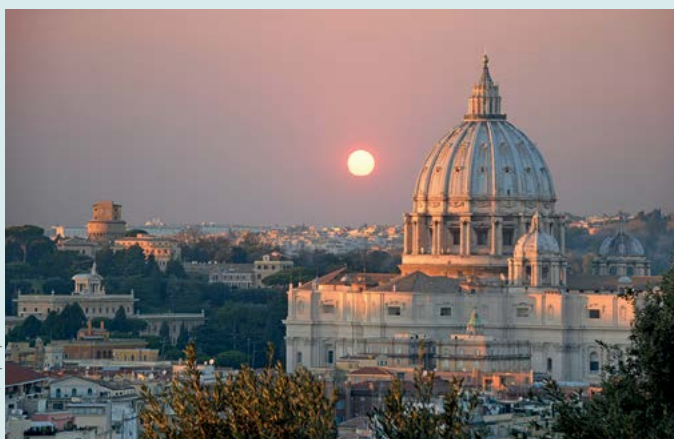
Zachód słońca widoczny ze wzgórza Janikulum

Podziwianie zachodu słońca ze wzgórza Janikulum przy lampce wina, w małej kawiarence z widokiem na Wieczne Miasto (s. 118).