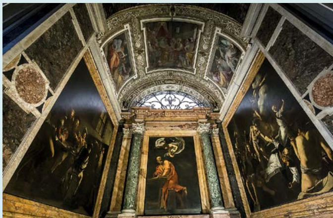
Kościół S. Luigi dei Francesi

Podziwianie dzieł Caravaggia w kościele S. Luigi dei Francesi, w którym znajdują się trzy obrazy przedstawiające wydarzenia z życia św. Mateusza (s. 84).