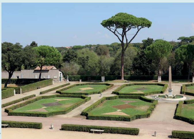
Ogrody wokół Villi Medici

Zwiedzanie renesansowych ogrodów Villi Medici, jednego z najbardziej tajemniczych miejsc Rzymu, które było inspiracją dla wielu artystów (s. 94).