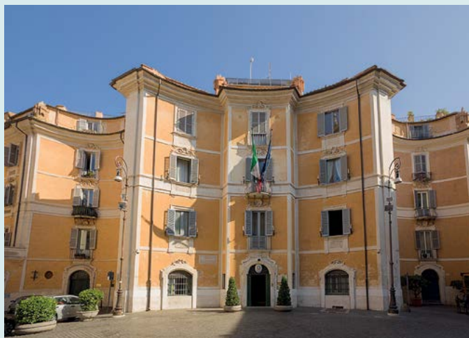
Piazza S. Ignazio

Spacer po piazza S. Ignazio , placu o palladiańskiej dekoracji, oraz po kościele pod tym samym wezwaniem, w którym można podziwiać freski trompe l'œil na sklepieniu, wykonane przez Andrea Pozza (s. 75, 76).