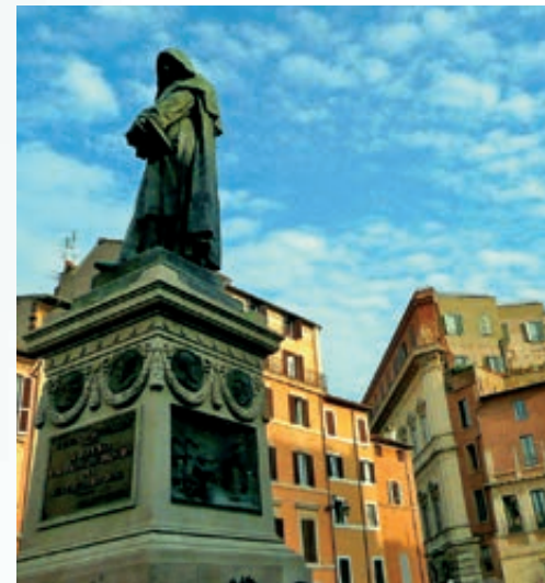
Campo dei Fiori Pomnik Giordana Bruna.