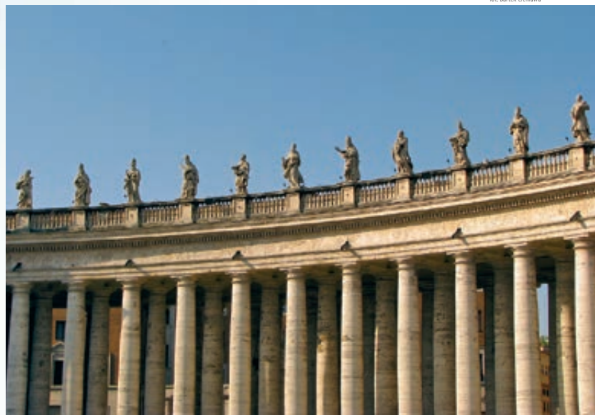
Basilica di San Pietro Rzeźby Berniniego wieńczące kolumnadę w pobliżu największej bazyliki Rzymu.