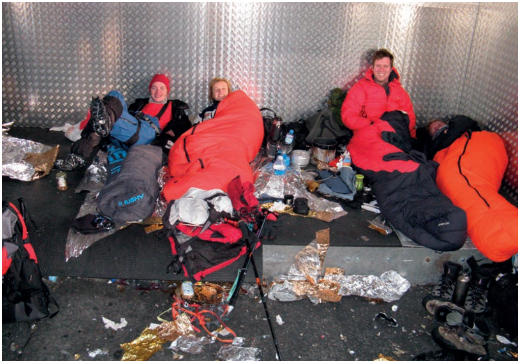
Schron Vallot na 4362 m n.p.m. Metalowa buda, w której nocowaliśmy po ataku szczytowym

dwulatka i osoba, która nawet jeszcze nie zaczęła zawodowej kariery, wdrapałam się na ponad 4800 metrów! Dokładnie tak, jak to sobie wcześniej zaplanowałam. No dobra, nie tak dokładnie. Szykując się do tej wyprawy, to i owo przeczytałam na temat tej góry. Wiedziałam, że nie jadę w Bieszczady i że może być groźnie. Że na przykład przez