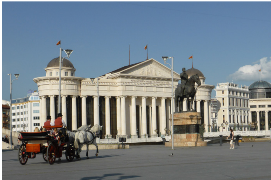
Pomnik Goce Delczewa, w tle Muzeum Archeologiczne Monopteros (część zachodnia placu)

Do 1941 r. na palcu stały pomniki konne króla Serbi Piotra I Karadziordzewicia (1844–1921) i jego syna Aleksandra I Karadziordzewicia (1888–1934).