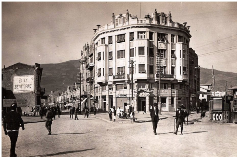
Pałac Risticia na pocztówce z lat 30. XX w. (budynek ocalał w 1963)

Pałac Risticia stworzyli Serbowie – projekt Dragutin Maslać (Драгутин Маслаћ), dekorację rzeźbiarską Dragutin Stanković (Драгутин Станковић).