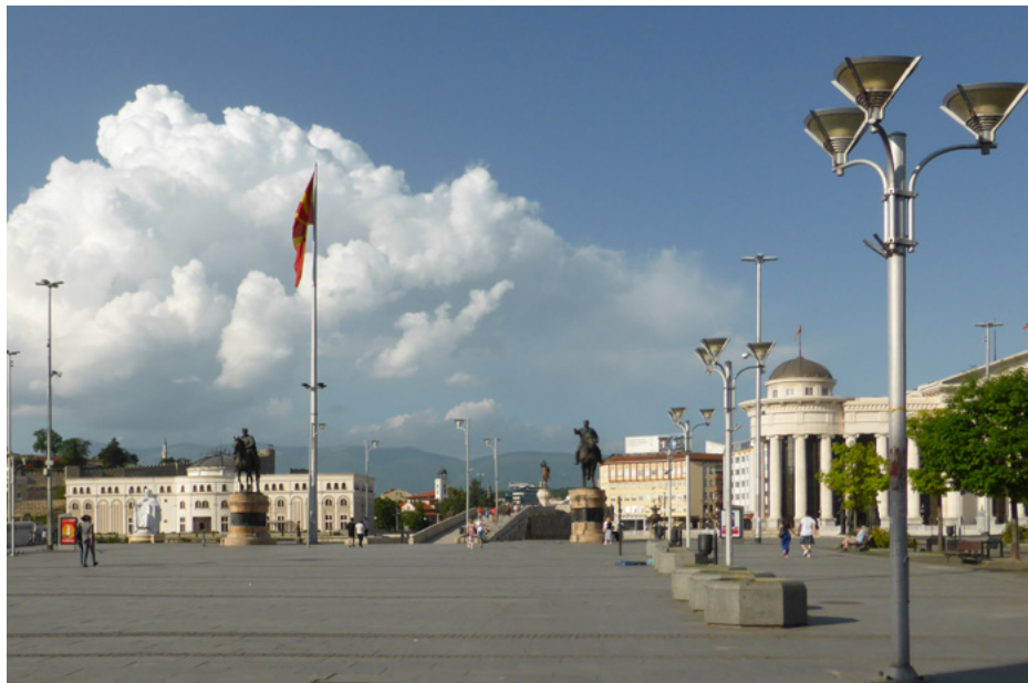
Plac Macedonia, w tle Muzeum Walki Macedończyków i Muzeum Archeologiczne

Na placu stoją też pomniki konne rewolucjonistów: Goce Dełczewa (fot. z lewej) i Dame Gruewa (fot. z prawej).