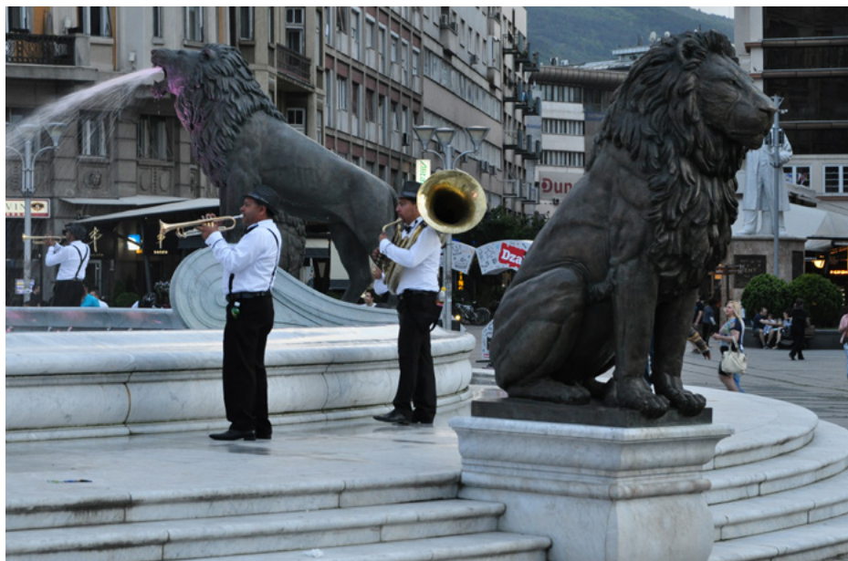
Na placu Macedonia, przy fontannie