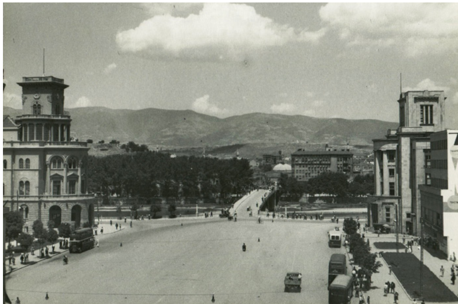
Fotografia z lat 50. XX w. (z lewej Kasyno Oficerskie, z prawej bank narodowy)

W czasach komunizmu (Socjalistycznej Federacyjnej Republiki Jugosławii) był to plac Marszałka Tito (wcześniej nie miał nazwy).