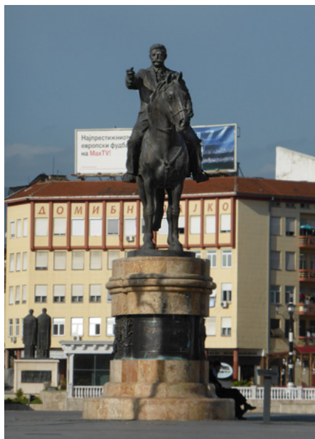
Pomnik Goce Delczewa