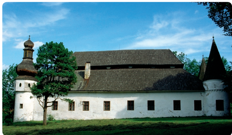
Liptovská Štiavnica – kasztel

Będąc w Ružomberku warto wspiąć się również na niewysokie, ale dość strome wzgórze Mnich (Mních, 695 m n.p.m.), na którym widoczne są ślady wałów kilku grodzisk kultur łużyckiej i puchowskiej. Trud wejścia wynagrodzą nam ponadto wspaniałe widoki na okoliczne pasma górskie, zaś schodząc do wsi MARTINČEK miniemy po drodze niewielki kościół św. Marcina , powstały ok. 1260 r., z cennym zespołem gotyckich malowideł z ok. 1300 r. – ich odsłonięcie spod XVII-wiecznych tynków w latach 1999–2001 było praw-