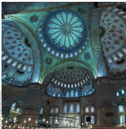
Wnętrze Błękitnego Meczetu zdobią niebieskie płytki z lzniku

Konkurent bazyliki Hagia Sophia – podobnie jak ona zachwyca harmonijnymi proporcjami oraz imponującym wnętrzem. Świątynia zawdzięcza swoją właściwą nazwę fundatorowi, sułtanowi Ahmedowi, zaś przydomek nawiązuje do zdobiących ją 20 tys. niebieskich płytek ceramicznych z lzniku.