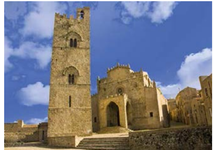
▲ Katedra w Érice

„Ettore Maiorana”, które gości corocznie międzynarodowe seminaria fizyki atomowej oraz przedstawicieli wielu uczelni o różnych specjalizacjach dotyczących problemów współczesnego świata.