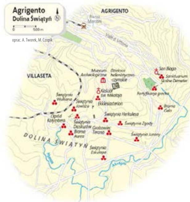
oprac. A. Tworek, M. Czopik

Romantyczne, malownicze ruiny cztero- (z pierwotnie 34 kolumn) północno-wschodniego rogu świątyni Dioskurów stały się symbolem Agrigento. Na kolumnach i architrawie są nadal widoczne ślady białego stiuku, który kontrastował z polichromowaną dekoracją wyższej partii belkowania (fryz i gzyms). Z tyłu znajduje się okrągły ołtarz z wgłębieniem w centrum na dary bothros , który tworzy część archaicznego sanktuarium bóstw chtonicznych (podziemnych).