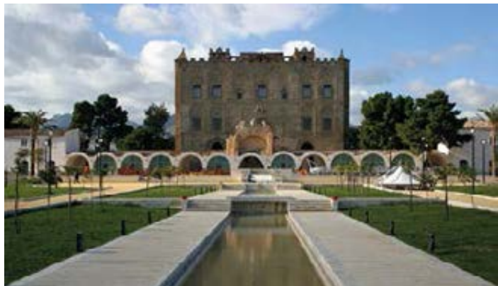
▲ Palazzo Della Zisa

tego pałacu myśliwskiego pochodzi od arabskiego słowa al-aziz , czyli „wspaniały” – za panowania władców normandzkich – Wil-