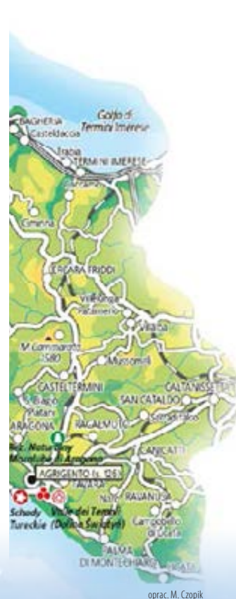
oprac. M. Czopik