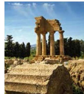
▲ Świątynia Kastora i Polluksa

zczenia i zaniedbania w 1999 r. FAI (Fondo per l'Ambiente Italiano – Fundacja dla Środowiska Włoskiego) rozpoczęła restaurację upraw i pejzażu antycznego basenu Kolymbetra. Rośnie tu wiele unikatowych gatunków, a część spośród nich nie jest już spotykana poza ogrodem. Znajdują się