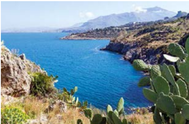
▲ Rezerwat „Lo Zingaro”

Droga wiedzie przez jeden z najbardziej malowniczych zakątków Sycylii, wzdłuż północnego brzegu wyspy, gdzie kryształowe morze obejmuje w miłośnym uścisku najpiękniejszą plażę wyspy. Dalej przez terytorium dawnej osady Góry św. Juliana (jak nazywano Érice w średniowieczu), obok rezerwatu „Lo Zingaro” („Cygan”) i góry Monte Cofano, aż do najważniejszego sanktuarium tego obszaru – bastionu chrześcijaństwa, fortu św. Wita. Szlakiem, wzdłuż którego znajdują się liczne kapliczki zachęcające do zastanowienia i kontemplacji, którym wędrują pielgrzymi w stronę Érice lub w przeciwnym kierunku, w stronę domu świętego męczennika Wita. Był on synem poganina, senatora Mazzary Gelasa, ale wychowany został w duchu chrześcijańskim przez piastunkę Krescencję i jej męża Modesta. Gdy miał siedem lat (wg niektórych wersji dwaście) jego ojciec dowiedział się o wierze syna i usiłował go od niej odwieść – naj-