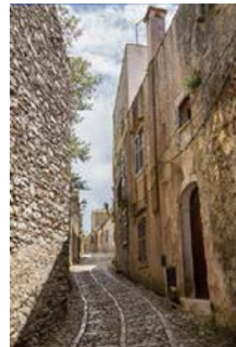
▲ Średniowieczna uliczka w Érice

nie tylko z cudownych zabytków i zapierających dech w piersiach widoków, ale także z prestiżowego centrum kultury naukowej