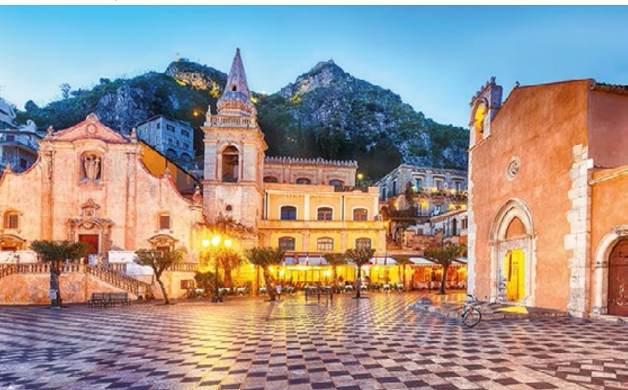
▼ Piazza IX Aprile

W 902 r. Tauromenium przeszło w ręce Arabów. Przyczynili się oni do rozwoju rolnictwa, wprowadzili nowe techniki użytku ziemi i nowe uprawy. W 1409 r. w Taorminie odbyło się pierwsze zebranie parlamentu sycylijskiego zwołane w celu wyboru sukcesora króla Sycylii Marcina Młodszeo, który zmarł bezpotomnie. Wyznaczony do pełnienia tej funkcji ojciec króla, Marcin I, zrzekł się władzy na rzecz synowej Bianki di Navarry. Do 1713 r. na wyspie panowali Hiszpanie, później władza przeszła na krótko w ręce Sabaudów, następnie Habsburgów. W 1734 r. na Sycylii ponownie zapanowali Hiszpanie z Karolem III Burbonem. Pobliskie Naksos było w średniowieczu portem Taorminy, a z czasem rozwinęło się w wiejską osadę, gdzie uprawiano głównie cytrusy, i zyskało miano „wioski-ogrodu”