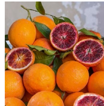
▲ Pomarańcze – odmiana tarocco