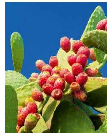
▲ Opuncja figowa

Sycylia słynie z doskonałych win regionalnych: nero d'Avola, marsala, malvasia i passito, etna bianco i etna rosso.