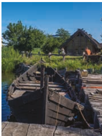
▲ Centrum Słowian i Wikin- gów Jomsborg Vineta