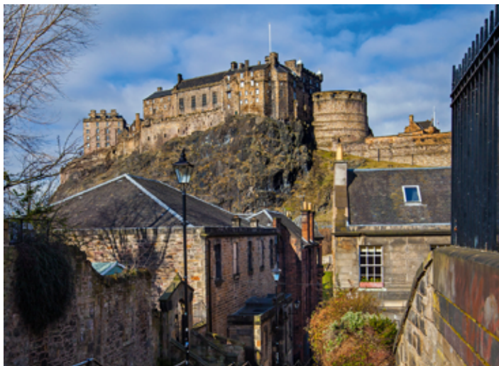
▲ Charakterystyczna sylwetka zamku edynburskiego

Kopciuchem” (Auld Reekie). Większość szkockich zakładów przemysłowych w XIX stuleciu znajdowała się jednak w Glasgow, dlatego w Edynburgu ulokowane zostały tuzy szkockiej finansjery, prawa i literatury. Najslawniejsi szkoccy pisarze i autorzy nazywali wówczas miasto Atenami Północy.