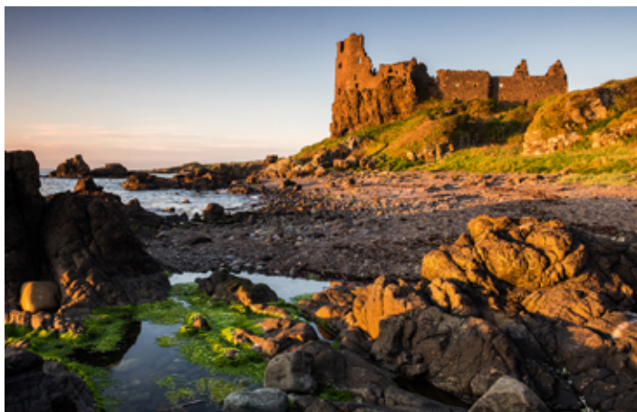
▲ Malownicze ruiny zamku Dunure

i apoteozie wiejskiego, spokojnego życia, a głównym motywem przewodnim było hasło: „Miłość wszystko zwycięża”.