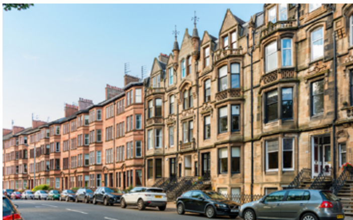
▲ Zabudowa dzielnicy West End