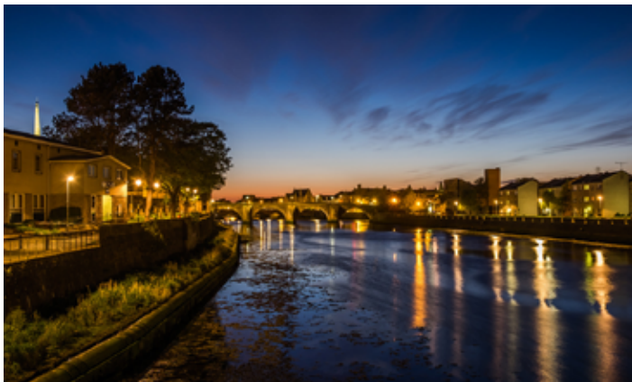
▲ Ayr nocą

liczba zabytkowych kościołów, klasztorów i opactw, skupionych głównie na pograniczu szkocko-angielskim. Dziedzictwo to decyduje o turystycznym potencjale regionu, pozbawionego bogatych muzeów i zabytków miast, ale oferującego niezdeptane szlaki i podróże śladem dawnej kultury szkockiej.