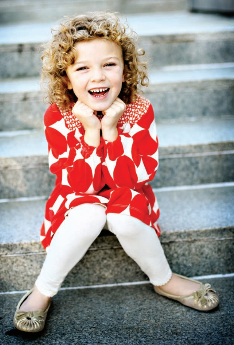
Fot. Julia Greer