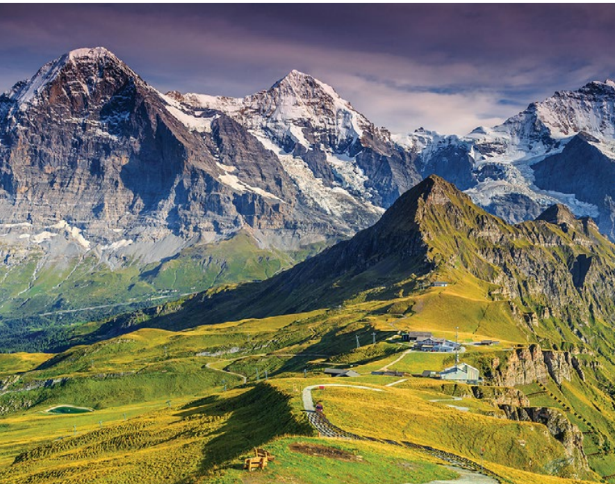
▲ Stacja Männlichen, w tle Eiger, Mönch i Jungfrau