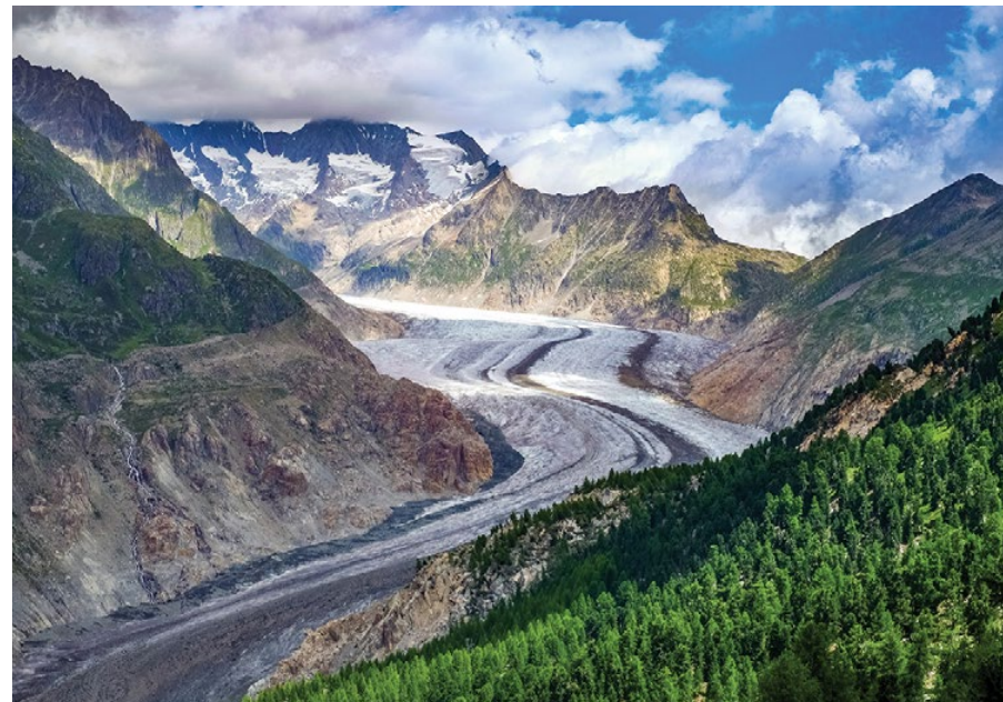
▲ Lodowiec Aletsch

Górną część doliny Lauterbrunnen obejmuje rezerwat przyrody. Masyw Jungfrau wraz z lodowcem Aletsch i szczytem Bietschhorn zostały wpisane na listę światowego dziedzictwa UNESCO. Pierwszego wejścia na tę imponującą górę