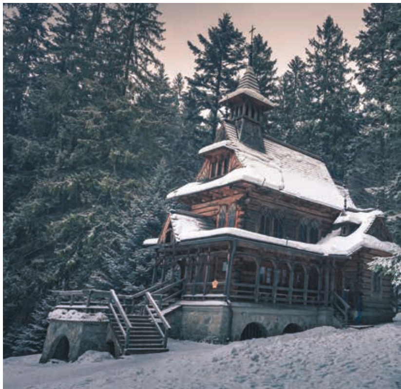
▲ Kaplica Najświętszego Serca Pana Jezusa na Jaszczurówce

50. XX w. w stylu nawiązującym do zakopiańskiego. Tutaj można znaleźć najtańsze noclegi w centrum Zakopanego.