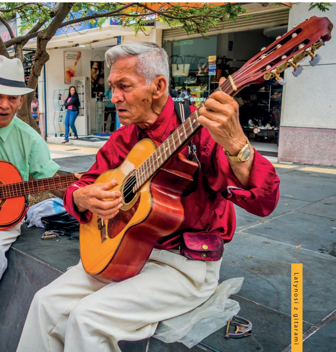
Latynoski z gitarami