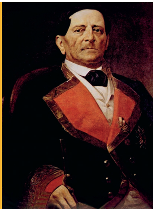
Generał Antonio López de Santa Anna

Latynosi, w tym przypadku Meksykanie, mieli jej serdecznie dosyć. Słowa green grow zły się w gringo . To określenie od początku wiązało się z USA i oznaczało obcokrajowca w ujęciu negatywnym. Bariera geograficzna i bariera językowa sprawiły, że upowszechniło się przede wszystkim na terenie Ameryki Południowej. Większość mieszkańców krajów leżących dalej na południe, takich jak Kolumbia, Peru, Ekwador czy Boliwia, nigdy nie podróżowała, nie miała więc okazji, by zetknąć się z obywatelami USA, niemniej do społeczeństw latynoskich przenikła informacja, że gdzieś daleko na północy istnieje kraj „Gringolandia”. W ramach konfliktu między USA a Meksykiem zaistniały też inne zabawne zbiegi okoliczności, które mogły spowodować, że Meksykanie zaczęli określać mieszkańców Stanów Zjednoczonych mianem gringos . Po pierwsze, podczas bitwy o Alamo w 1846 roku wojska amerykańskie ubrane były w zielone mundury. Sytuacja była dramatycznie zła, a Meksykanie mieli ponoć krzyczeć do przeciwników łamanym angielskim: „Wy-noście się!”, „Zieloni muszą odejść!!!”, czyli w uproszczeniu: „Grin-go” (od Green go ). Po drugie, w trakcie wojny meksykańsko-amerykańskiej postrachem Meksykanów był wyjątkowo dobrze wyszkolony amerykański Zielony Batalion. Jego dowódca, zagrzewając żołnierzy do walki, krzyczał: „Zieloni, naprzód!” („ Green, go! ”). Po trzecie, w trakcie walk wśród żołnierzy rozeszła się wiadomość, że jeden z dowódców armii USA,