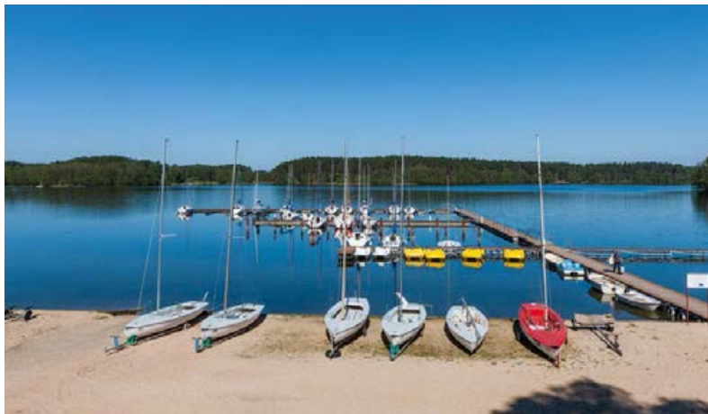
▲ Przystań w Borsku

Po krótkim odcinku asfaltowym znów odbijamy w szutrową drogę. Skręciwszy na południe, ponownie zbliżamy się do wysokiego brzegu jeziora, tym razem