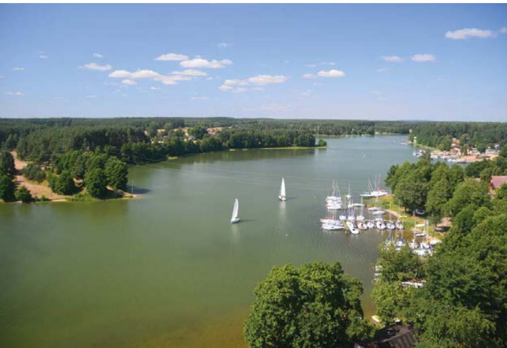
♣ Jezioro Jelenie – północne ramię Jeziora Wdzydzkiego

35,6 m. Wygodne schody prowadzą na trzy tarasy widokowe. Z najwyższego możemy podziwiać panoramę wszystkich części Kaszubskiego Morza i niektóre wyspy. Na południu panoramę zamykają wzgórza nieopodal Wiela, a patrząc na północ, zobaczymy w dali Wzgórza Szymbarskie z Wieżą.