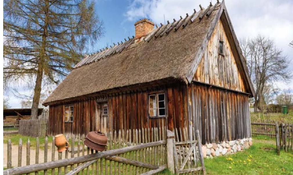
⤴ Chatupa zagrodnika z Borska w Kaszubskim Parku Etnograficznym