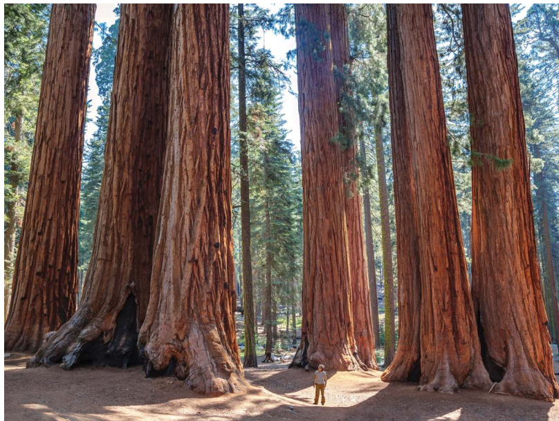
Park Narodowy Sekwoi

Warto wiedzieć: w zależności od preferencji i kondycji fizycznej stawiamy na wędrówki po parkach i korzystamy z różnych ofert przygotowanych przez poszczególne miasta. Podróżując z dziećmi, wybierzmy się do Disneyland Resort w okolicach Los Angeles.