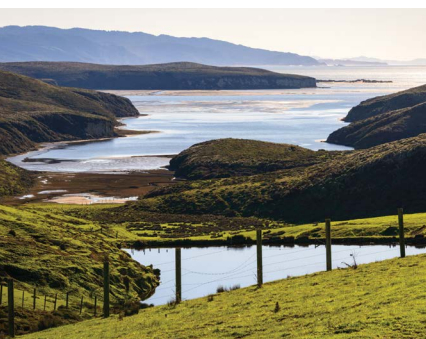
Point Reyes National Seashore