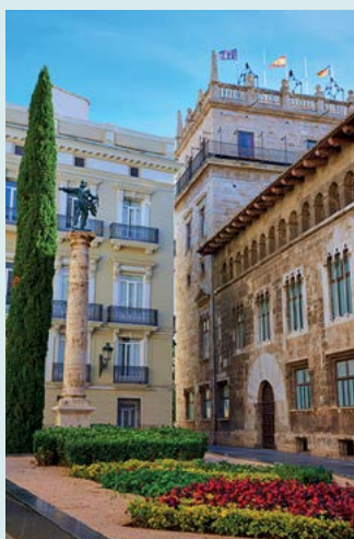
Palau de la Generalitat Valenciana

Wędrując przez miasto, obejrzyj elegancki Pałac Muzyki ( Palau de la Música , s. 99). Wejdź z dziećmi do znajdującego się obok Parku Guliwera ( Parque Gulliver , s. 99). Gdy zauważysz osobliwe rzeźby zwierząt, to znak, że jesteś w Mieście Sztuki i Nauki ( Ciudad de las Artes y las Ciencias , s. 103). Zwiedź 6-piętrowy geometryczny i asymetryczny budynek autorstwa architektów futurystów – Santiaga Calatravy i Félix Candelá . Koniecznie odwiedź też Muzeum Nauki ( Museo de las Ciencias Príncipe Felipe , s. 105) oraz Oceanarium ( Oceanográfico , s. 105), w którym mieści się największe akwarium w Europie.