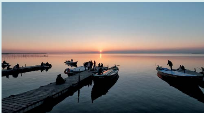
Park Naturalny Albufera

Po wypełnionej atrakcjami nocy odpocznij od zgiełku miasta na łonie natury. Wybierz się do Parku Naturalnego Albufera (s. 114), opłyn łódką stawy i kanały, obejrzyj chaty walenckich chłopów ( barraca ) i spróbuj tradycyjnych walenckich potraw w jednej z restauracji El Palmar .