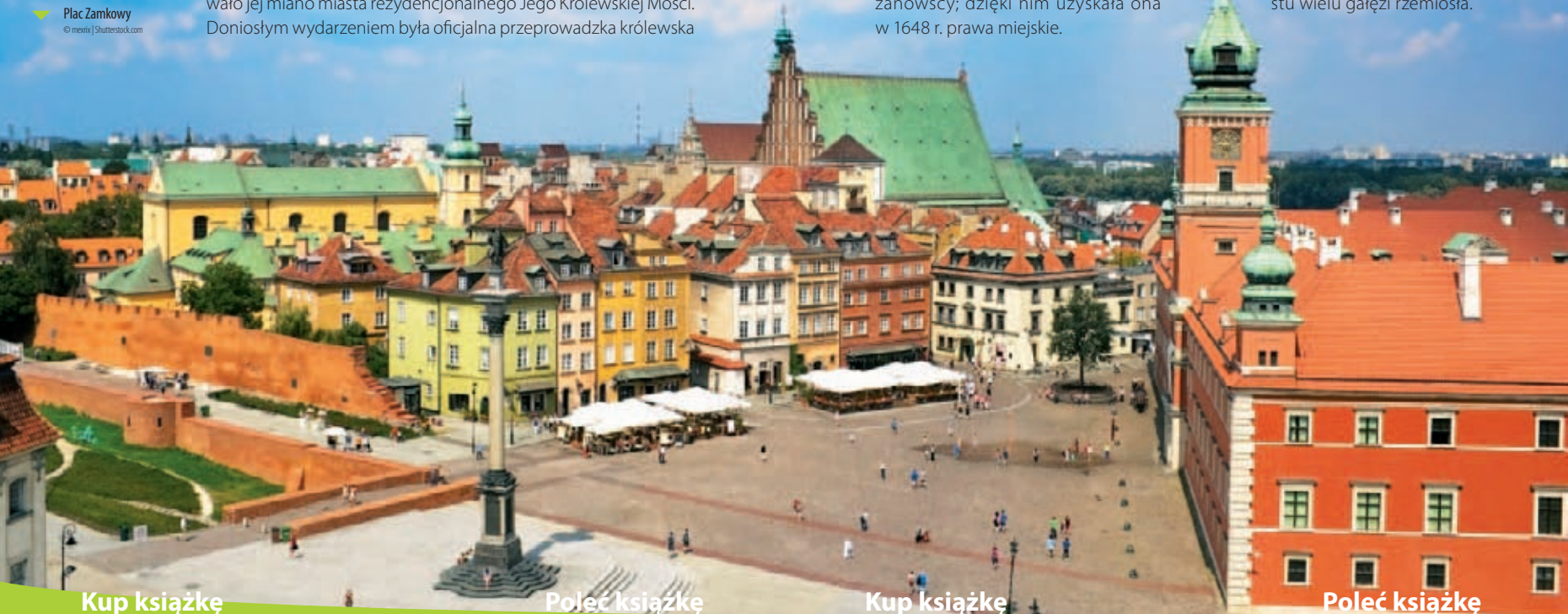
Plac Zamkowy

Szczególny pierścień tworzyły wznoszone wokół Starego i Nowego Miasta prywatne miasteczka magnackie zwane jurydykami . Lokowane na gruntach podmiejskich, na prawach chełmińskim i magdeburskim, wydzielone były spod działania sądownictwa i administracji miejskiej oraz zwolnione z opłat na rzecz stolicy. Posiadały własne prawa, zwyczajne, straże, ratusze, a nawet herby. Stanowiły poważną konkurencję gospodarczą, wprowadzając podział na Warszawę magnacką i mieszczańską. Rozbiły strukturę organizmu miejskiego, utrudniając jego regularny rozwój terytorialny oraz gospodarczy. Powodowały trudności w administrowaniu, uniemożliwiając np. rozplanowanie układu dróg. Z drugiej strony przyczyniły się do rozwoju terytorialnego miasta oraz wzrostu wielu gałęzi rzemiosła.