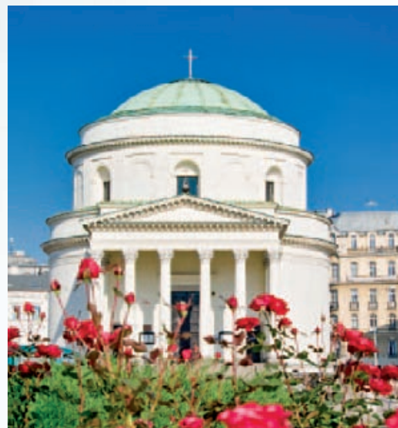
Kościół św. Aleksandra