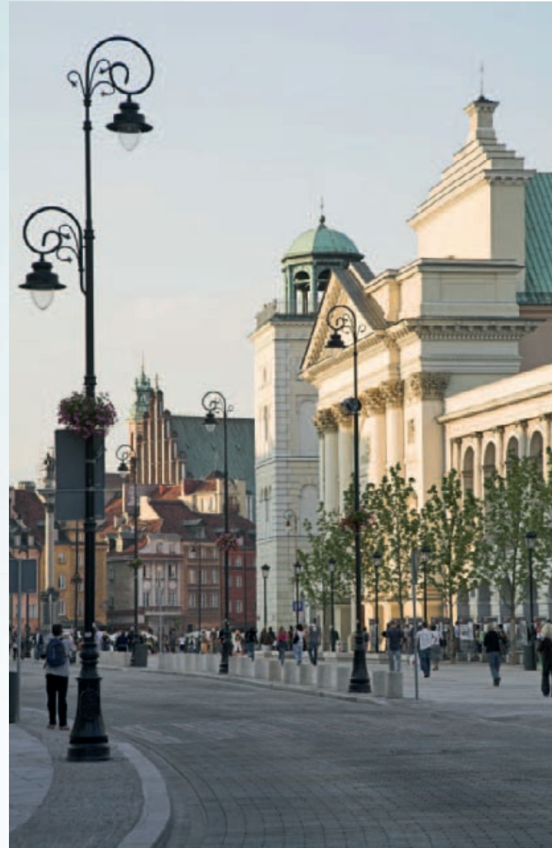
Kościół św. Anny – świątynia akademicka Warszawy

3 czerwca 1979 r. kościół św. Anny odwiedził, podczas swojej pierwszej pielgrzymki do ojczyzny, papież Jan Paweł II. Zdarzenie to upamiętnia tablica przy wejściu do świątyni.