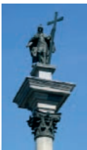
Kolumna Zygmunta

przestrzeń stała się za mała. W 1408 r. Janusz I nadał przywilej lokacyjny, tzw. Nowej Warszawy , położonej na północ od pierwotnej i nigdy nie otoczonej murami miejskimi. Jej oś tworzyły ulice: Freta i Zakroczymska, a centrum stanowił prostokątny rynek. Założone na regularnym planie miasto zasiedlała uboższa ludność. Przez długie lata dominowały tu zabudowania drewniane, wśród których wyróżniały się dwa murowane kościoły: św. Jerzego oraz Najświętszej Marii Panny. O odrębności organizmu miejskiego stanowiły: własna rada, osobny wójt i odmienny herb. Administracyjne połączenie obu miast nastąpiło w 1791 r.