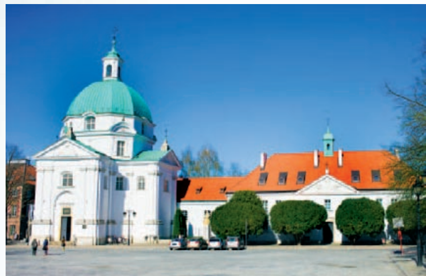
Kościół Sakramentek na Ryнку Nowego Miasta