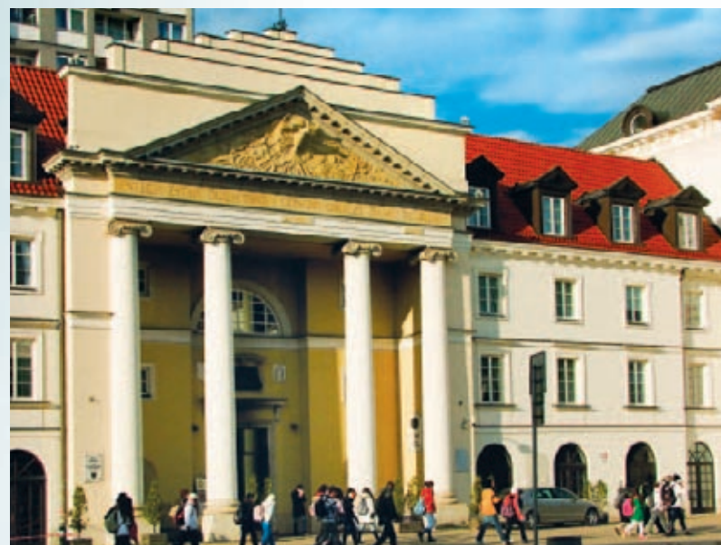
Kościół Środowisk Twórczych, najmniejsza świątynia w Warszawie