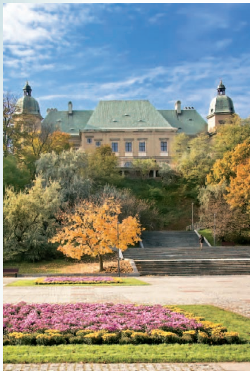
Zamek Ujazdowski, widok od strony Agrykoli

W 1954 r. zdecydowano o rozebraniu murów budowli, spalonej w 1944 r. Pozostały jedynie piwnice i koncepcje ich zagospodarowania. W latach 60. XX w. część istniejących pawilonów przeznaczono na magazyny. W 1974 r. zdecydowano o odbudowie zamku. Został zrekonstruowany w swym pierwotnym, wczesnobarokowym kształcie. Obecnie w zamku mieści się Centrum Sztuki Współczesnej . To miejsce nie tylko prezentacji i dokumentacji współczesnej sztuki, ale również jej tworzenia. Obszar zainteresowań CWS jest bardzo obszerny. Obejmuje: malarstwo, rzeźbę, grafikę, rysunek, instalację, sztukę obiektu, performance, fotografię, sztukę komputerową i wideo, dźwięk, multimedia, film i teatr. Sednem jego działalności jest ukazywanie tych różnorodnych dyscyplin w procesie ich przemian podczas reagowania na aktualne światowe zjawiska kulturalno-cywilizacyjne. Ekspozycja stała przedstawia Międzynarodową Kolekcję Sztuki Współczesnej; ponadto odbywają się tu spektakle, koncerty, wystawy, pokazy i prezentacje, spotkania autorskie, wykłady, seminaria, warsztaty oraz pokazy filmowe realizowane przez KINO.LAB, prezentujące światowy dorobek sztuki ruchomego obrazu, z naciskiem na twórczość niezależną.