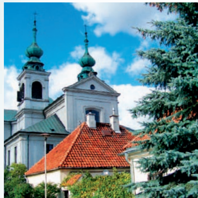
Kościół pokamedulski

Charakterystycznym elementem 79 Rynku Nowego Miasta jest kościół Sakramentek pod wezwaniem św. Kazimierza. Dominuje nad placem dzięki wspaniałej kopule i latarni. Pierwotnie był rezydencją magnacką, która została odkupiona przez królową Marię Kazimiერę Sobieską (zwaną Marysieńką) i zamieniona na kościół dla upamiętnienia zwycięstwa pod Wiedniem oraz z przeznaczeniem na mauzoleum rodzinne. W ufundowanym w 1688 r. przybytku umieszczono sprowadzony z Francji zakon panien sakramentek. Barokowy budynek o centralnym założeniu wzniesiono na planie krzyża greckiego i zwieńczono wspomnianą kopułą, osadzoną na ośmiobocznym bębnie. Kościół oddano do użytku w stanie surowym i dopiero w 1715 r. konsekrowano ołtarz, zbudowany według zmodyfikowanych planów Tylmana z Gameren. 25 lat później wzniesiono utrzymany w barokowym stylu budynek klasztorny, ufundowany przez Radziwiłłów