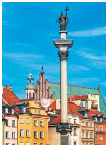
▲ Kolumna Zygmunta III Wazy

📍 Zamek Królewski , pl. Zamkowy 4. Dojazd: autobus – 116, 128, 175, 178, 180, 222, 503, 518, N44 przystanek „Plac Zamkowy”; autobus – 118, 185 przystanek „Podzamcze”; autobus – 160, 190, 226, 527, N11, N16, N21, N61, N66, N71 przystanek „Stare Miasto”; tramwaj – 4, 13, 20, 23, 26, T przystanek „Stare Miasto”; tel.: 22 3555170;