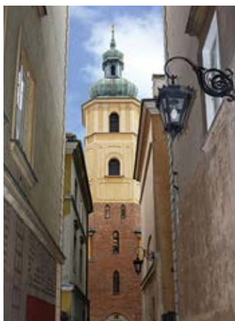
▲ Kościół św. Marcina przy ul. Piwnej

Znajduje się dosłownie tuż obok archika- tedry i pozostaje nieco w jej cieniu, choć sama budowla kościoła jest nieznacznie wyższa (ma najwyższą wieżę w Starym Miście). Jednym z inicjatorów budowy tej późnorennesansowej świątyni, stop- niowo powiększanej, z okazałą kopułą i smukłą wieżą, był Piotr Skarga, a funda- torem m.in. Zygmunt III Waza. Budynek klasztorny wznosi się w miejscu dawnej kamienicy mieszczańskiej zakupionej na potrzeby konwentu. Sanktuarium także wiele przeszło: wnętrza świąty- ni zostały ograbione przez Szwedów w czasie ich najazdu, po kasacie zakonu zmieniali się właściciele, wśród których był również zakon pijarów, a podczas powstania warszawskiego całość zespołu klasztornego uległa zniszczeniu. W 1948 r. jezuici (którym zwrócono obiekt jeszcze przed II wojną światową) przystąpili do trwającej niespełna 10 lat odbudowy. Kościół kryje gotyckie podziemia będą- ce pozostałością zniszczonych w 1607 r. pożarem kamienic mieszczańskich. Znaj- dziemy w nim renesansowy krucyfiks pochodzący z Lubeki , nagrobek wojewo- dy lubelskiego Jana Tarły (przeniesiony z kościoła Pijarów), zabitego w 1750 r. w pojedynku z Kazimierzem Poniatow- ski, barokową rzeźbę Matki Bożej Łaska- wej znajdującą się w zakrystii oraz – a może przede wszystkim – umieszczo- ny w głównym ołtarzu, słynący łaskami obraz Matki Boskiej Łaskawej z pierw- szej połowy XVII w. , подарowany królowi