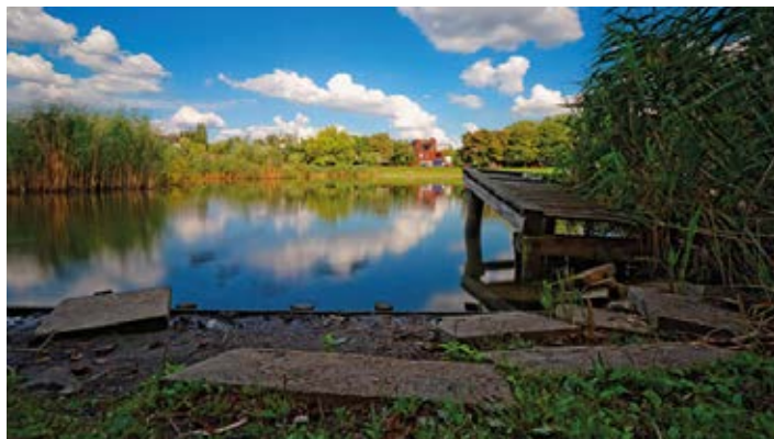
▲ W parku Szczęśliwickim

Biblioteka Narodowa , al. Niepodległości 213; dojazd: autobus – 167, 174, 700, N34, N36 przystanek „Biblioteka Narodowa”, tramwaj – 17, 33 przystanek „Biblioteka Narodowa”; tel.: 22 6082999, www.bn.org.pl ; otwarte: najpopularniejsze czytelnie oraz Informatorium pn.–sb. 8.30–20.30.