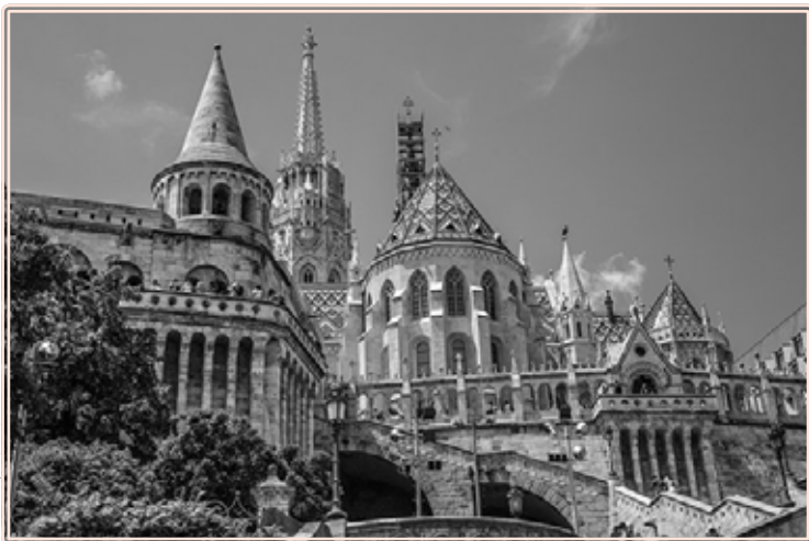
Widok na Basztę Rybacką i kościół Macieja

w pobliskim Gödöllő miała właśnie tutaj wysłać codziennie swą węgierską damę dworu i przyjaciółkę, Idę Ferenczy, po kremówki (wg innych wersji słała po nie nawet dylizansę z Wiednia).