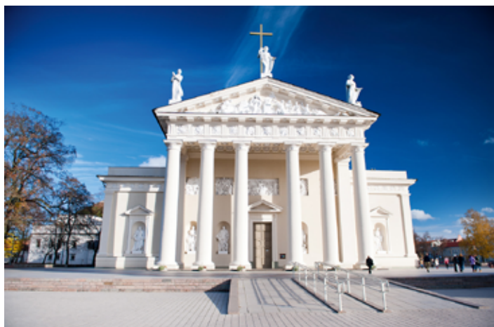
▲ Monumentalna fasada katedry wileńskiej

W XVIII w., na skutek nadwężenia murów katedry, biskup Ignacy Massalski zlecił przebudowę świątyni – dokonano jej pod kierownictwem wybitnego architekta Wawrzyńca Stuoki-Gucewicza. Budowla nabrała wyglądu klasycystycznego (zarówno jeśli chodzi o elewację, jak i wykończenie wnętrza), zachowując nadal gotycką bryłę. To była ostatnia znacząca przebudowa świątyni. Gmach zyskał sześciokolumnowy dorycki portyk,