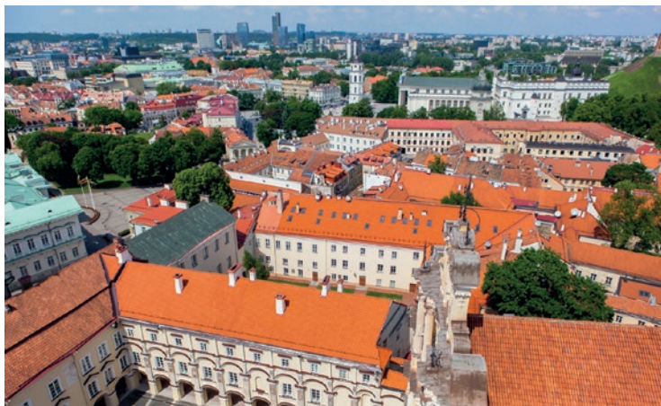
Rozległe zabudowania Uniwersytetu Wileńskiego

życia kulturalno-naukowego na Litwie. Związane z nią były tak wybitne postacie polsko-litewskiej historii, jak Adam Jerzy Czartoryski, Jan i Jędrzej Śniadeccy, Stanisław Bonifacy Jundziłł, Gotfryd Ernest Groddeck, Joachim Lelewel, Adam Mickiewicz, Juliusz Słowacki, Jan i Józef Frankowie, Szymon Dowkont (Simonas Daukantas), a później Ferdynand Ruszczyk, Czesław Miłosz i wielu innych.