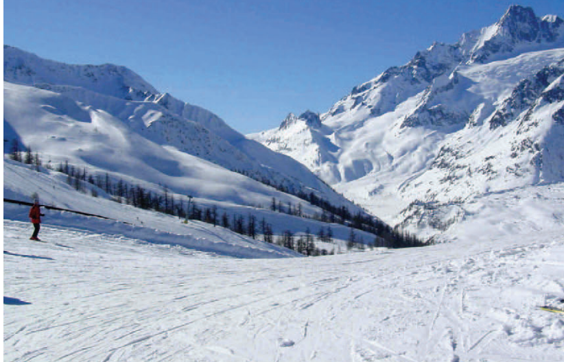
Courmayeur u stóp masywu Mont Blanc