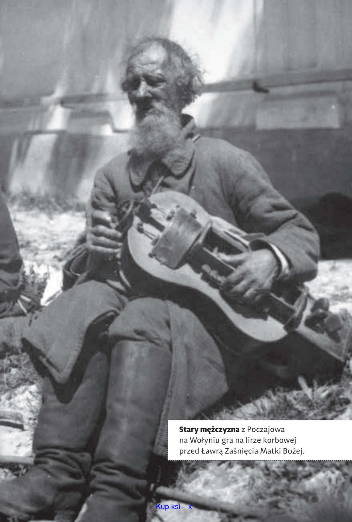
Stary mężczyzna z Poczajowa na Wołyniu gra na lirze korbowej przed Ławrą Zaśnięcia Matki Bożej.