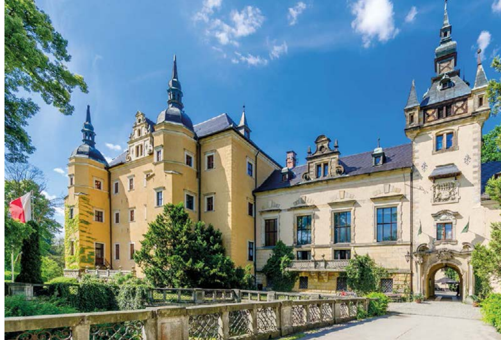
▲ Pałac w Kliczkowie

Wiadukt na rzece Bóbr, peretka inżynierii kolejowej, oddalony jest od starego miasta o nieco ponad 1 km (wyjście z rynku ul. Prusa, dalej prosto w Zgorzelecką i zaraz w prawo w ul. Dolne Młyny). Powstał on w zaledwie dwa lata, między 1844 a 1846 r., gdy do miasta doprowadzono linię kolejową. Wykonana z piaskowca przeprawa ma aż 490 m dłu-