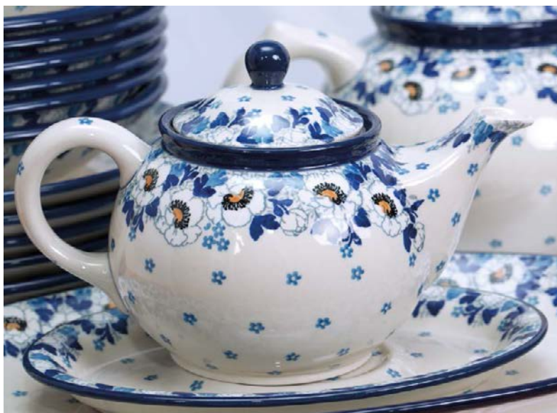
▲ Porcelana bolesławiecka

Wspaniałe wyroby, z których słynie Bolesławiec, możemy zobaczyć w Muzeum Ceramiki (dojście ul. Sierpnia 80, a potem skręt w ul. Mickiewicza). Obejrzeć tu można przedmioty produkowane przed 1945 r., a także stworzone w miejscowych zakładach po II wojnie światowej. Placówka ma jeszcze filię – Dział Historii Miasta przy ul. Kutuzowa 14, gdzie prezentowane są najważniejsze wydarzenia z dziejów Bolesławca, a także doskonała ceramika artystyczna. Duże wrażenie robi odtworzona XVI-wieczna apteka, z fiolkami i pięknymi stojami w stylowej gablocie.