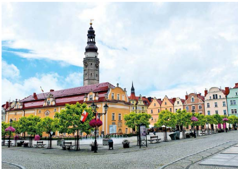
↗ Rynek w Bolesławcu

Rozległy rynek powstał na przecięciu szlaków handlowych z Pragi na północ i z Niemiec do Rusi. Niegdyś odbywał się na nim handel, dziś jest on przede wszystkim miejscem spotkań. Sprzyjają temu ładna, niedawno odnowiona zabudowa oraz liczne kawiarnie i restauracje. Rynek jest bardzo zadbane i tętni życiem, co jest rzadkością w dolnośląskich miastach. Najpiękniejszą budowlą na rynku jest ratusz , wzniesiony w 1. poł. XVI w. na miejscu wcześniejszej siedziby rajców, a w XVIII w. przebudowany w stylu barokowym. Zachowano jednak gotycką wieżę i nieco elementów wystroju wnętrza.