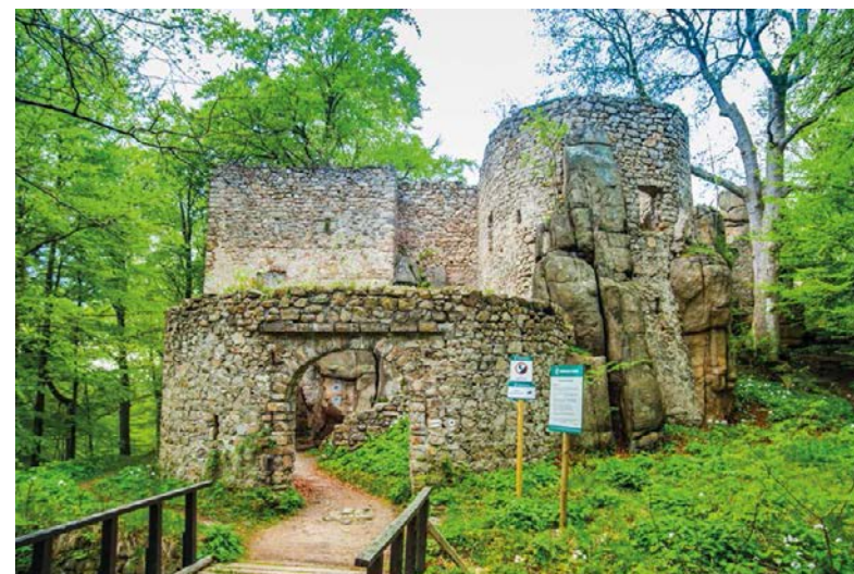
↗ Ruiny zamku Bolczów