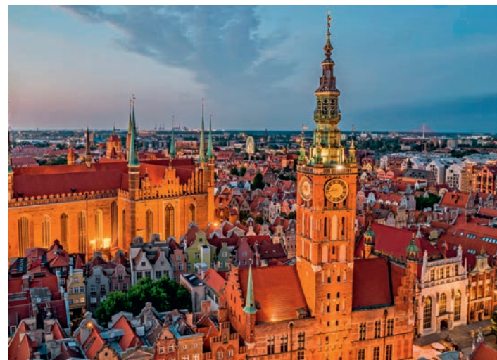
▲ Ratusz Głównego Miasta w Gdańsku

Gmach ten znajduje się na rynku zacisznego i przepięknego miasteczka. Budynek o konstrukcji ryglowej (inaczej: mur pruski) pochodzi z 1697 r.