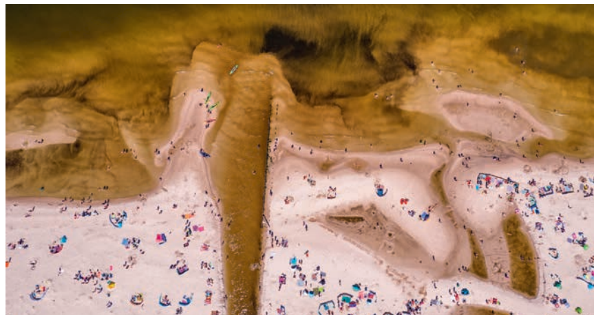
▲ Ujście Piaśnicy na plaży w Dębках

Po wejściu na plażę należy skręcić w lewo i iść wzdłuż brzegu przez ok. 1 km, a następnie zejść z plaży, idąc w głąb lądu. Po kilkuset metrach mija się pierwszą wiatę odпочynkową, a niedługo później drogą. Po prawej widać czoło ruchomej wydmie Stilo , będącej przykładem wydmy para-