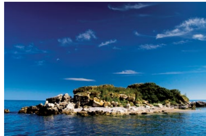
▲ Wybrzeże w okolicach Rusałki

Obfitość mniejszych i większych zatoczek nie pozostawia zbyt wiele miejsca dla piasku. Mimo to ustronne, romantyczne i płytkie zatoki doceniane są przez zwolenników słońca i morza. Gdziekolwiek z wody wystają skały, na które podpłynąć mogą amatorzy dyskretniejszego opalania. Według legendy miłośnikami tego miejsca byli również piraci ukrywający w skalnych zatoczkach swe skarby. Dziś skarbem jest możliwość aktywnego wypoczynku: żeglarstwo, nurkowanie, tenis, łucznictwo, kąpiele wodne (lecznicze natryski wodą mineralną – o temperaturze 38°C – znajdując się w miejscu rzymskich term) i borowinowe, oraz oferta rozrywkowa, z której słynie Club Med.