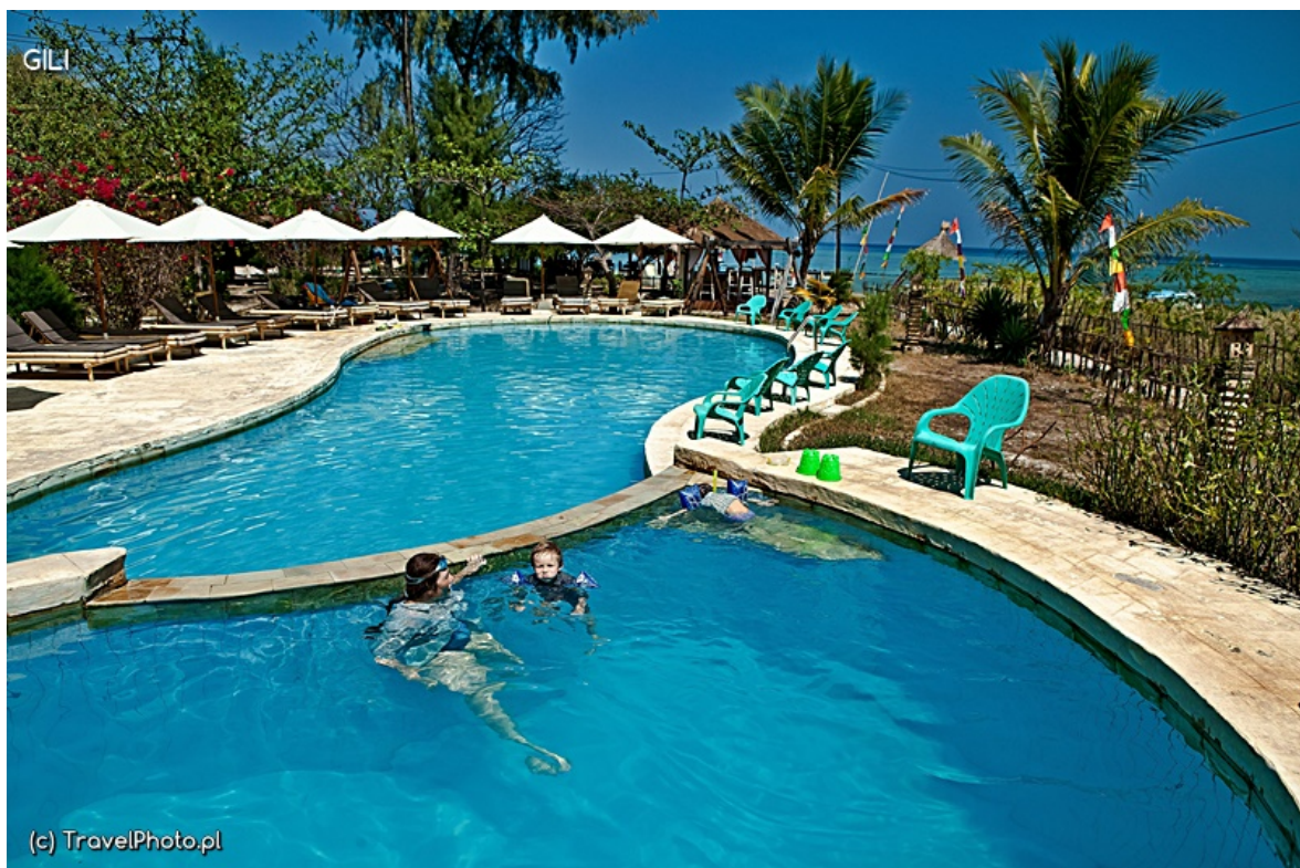
Nasz hotelowy basen.

Na Gili Air jest tylko jeden hotel z basenem, a że woda w nim słona, więc jest zdecydowanie tańszy niż na Trawanganie. Bierzemy! Bo cóż z tego, że woda słona? Przypominam sobie, jak mój brat, mając sześć lat, godzinami nie wychodził z basenu w Nigerii, gdzie przez kilka miesięcy mieszkaliśmy (w Nigerii, rzecz jasna, a nie w basenie). I jak zdumiał wszystkich, gdy przepłynąwszy (bez okularków!) z otwartymi oczami pod wodą dwie długości, wynurzył się, obtarł twarz i spytał taty, czy jeszcze ma pływać pod wodą? Bo jakby co, to on chętnie! Stanowczo nie doceniamy możliwości naszych dzieci! Byleby za bardzo nad nimi nie kwoczyć, a zaskoczą nas nieraz swym podejściem do życia.