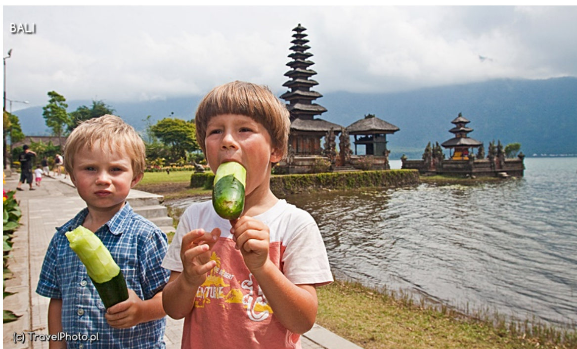
Ogórki "spokoju" (chwilowego).

– Teraz to pewnie będą bardzo spokojni! – żartuje Putu.