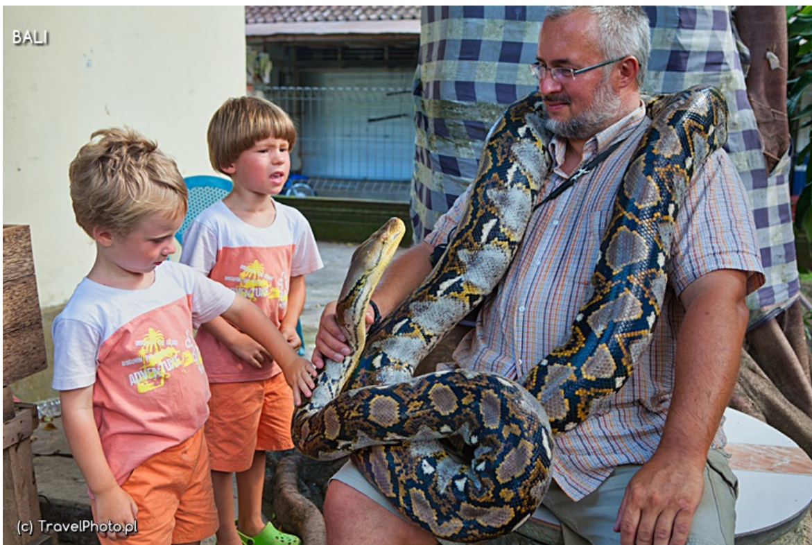
Chłopcy ubrali tatę w węża - świątynia Alas Kedaton.