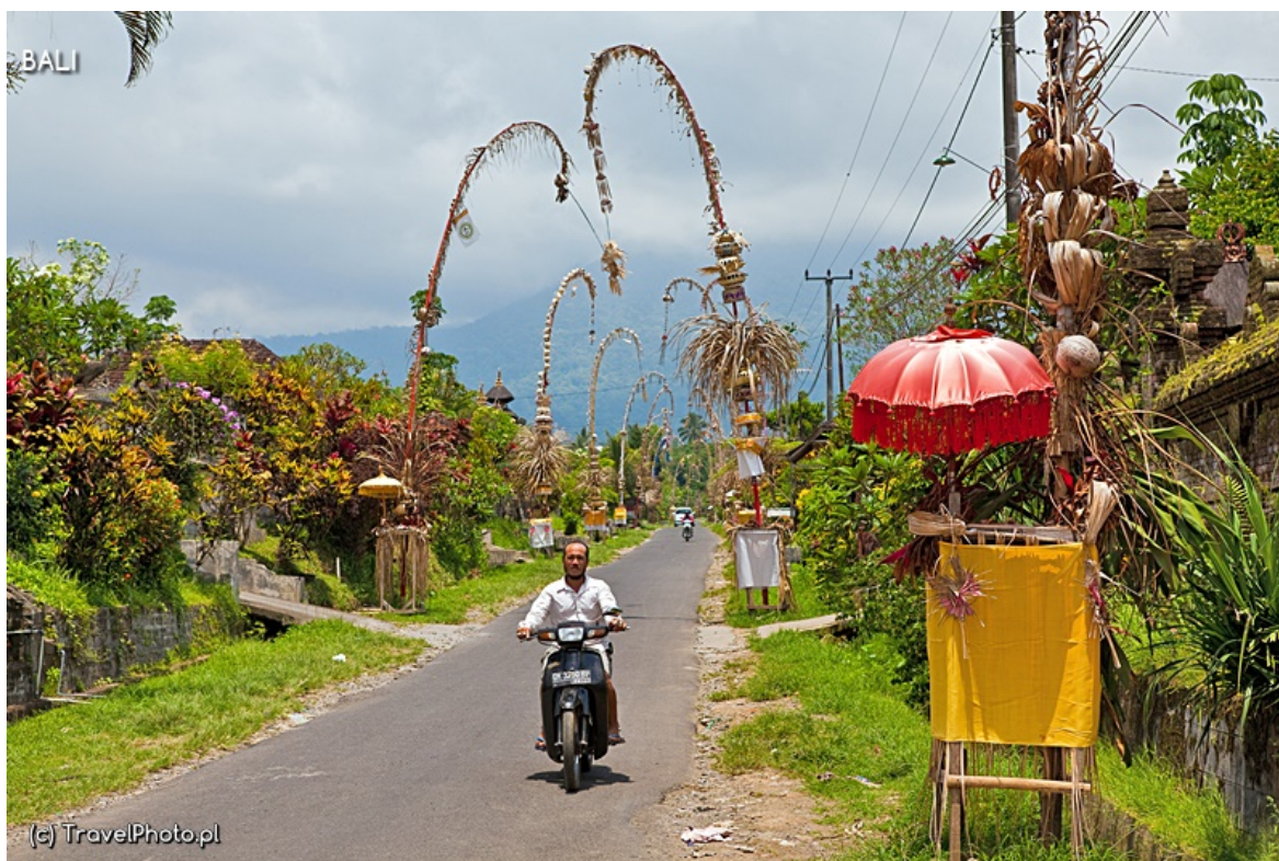
Drogi na Bali.