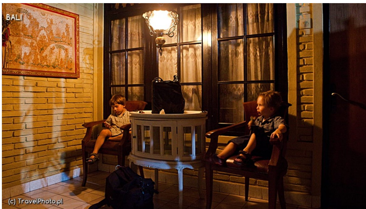
Nasz pierwszy hotel na Bali.