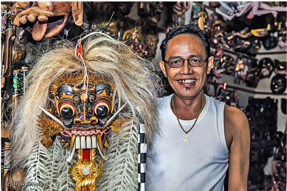
Maska którą kopiliśmy i jej autor.

sklepiarz jest jednocześnie ich twórcą. I swą sztukę wycenia na 200 dolarów. To naprawdę niedużo, w europejskiej galerii trzeba by za to zapłacić kilka razy więcej, ale przecież jesteśmy w Azji! Tu wręcz nie wypada tak od razu zapłacić. Zaczynamy długi rytuał targowania się, a że jesteśmy tu przez kilka dni, cena co dzień spada o kilka dolarów. On już wie, że na pewno tę maskę kupimy, my wiemy, że jego praca jest warta tej ceny. Wreszcie uznajemy, że dłużej targować się nie wypada. Za 140 dolarów stajemy się posiadaczami wspaniałej maski i... problemu, jak ją przewieźć do Polski?