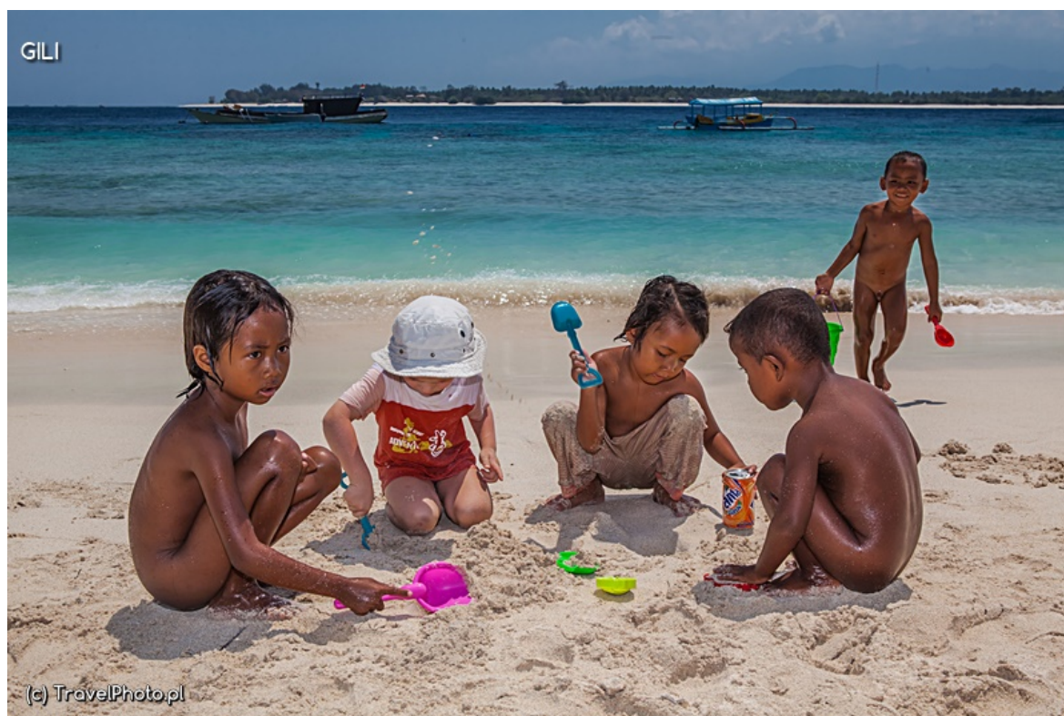
Zabawa z miejscowymi dziećmi.

Trawangan można objechać rowerem dookoła albo wejść o wschodzie słońca na wzgórze, z którego doskonale widać pozostałe wyspy.