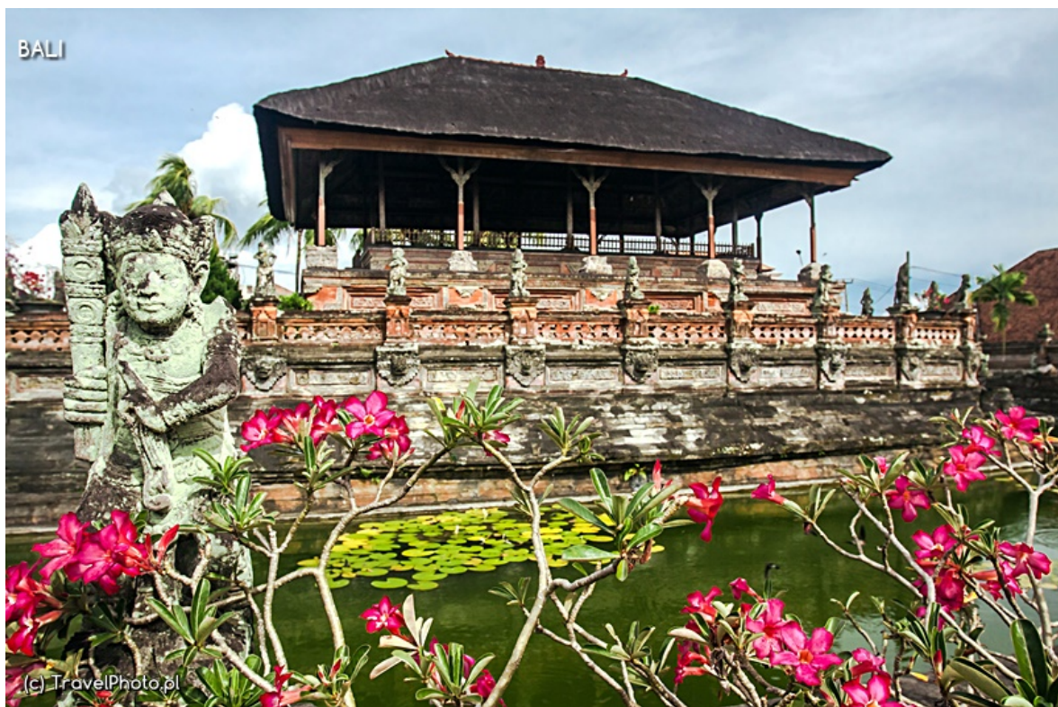
Klungkung - pozostałości pałacu królewskiego.

To miejsce szczególne, gdyż w XVIII wieku przeniesiono tu stolicę wyspy i zbudowano królewski pałac. Niewiele się po nim zachowało, ale to, co przetrwało do naszych czasów, jest sztuką doskonałą. Która tu trafiła pod strzechy. Dosłownie. Oto bowiem jeden z pawilonów ma dach kryty strzechą właśnie, natomiast od spodu całe jego wnętrze wypełniają misterne malunki przedstawiające sceny z Mahabharaty. A ponieważ dzieło to jest dziesięć razy dłuższe niż Iliada i Odyseja razem wzięte, znalazł się tu jedynie maleńki wycinek opowieści. W towarzystwie doświadczonego przewodnika malunki ożywają. Oto Bima w krainie cieni szuka dusz swych rodziców, a niechętni śmiertelnikowi bogowie i demony wypowiadają mu wojnę. Wyraziste postacie zamarły w pół gestu, zwarte w nierozstrzygniętej od wieków walce.