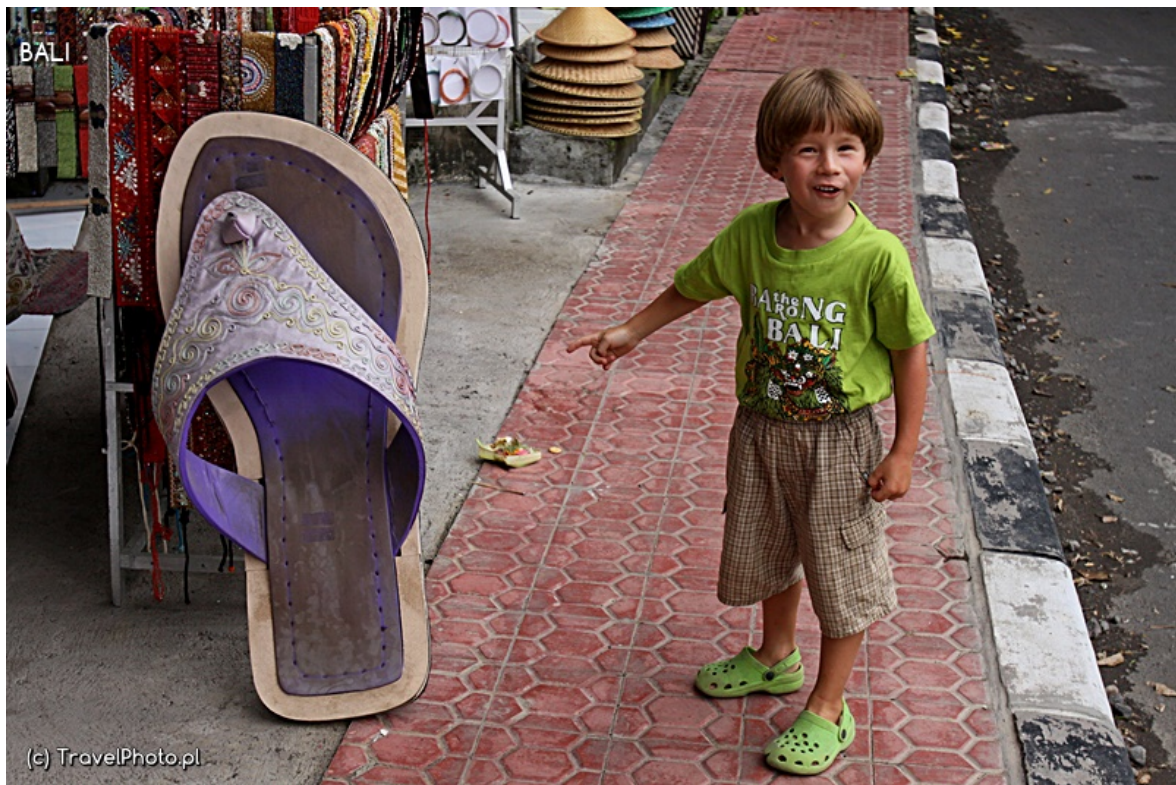
Na ulicach Ubud.

dosłownie wszystko – taśmy nigdzie znaleźć nie mogę, zwłaszcza że chyba nikt nie rozumie, czego szukam. W końcu zlitował się nade mną jakiś młody człowiek znający lepiej angielski i okazało się, że no problem – taśma jest na co drugim straganie! Jakim cudem nie widziałam jej wcześniej? Przez walkie-talkie odnajduję resztę rodziny w królewskim pałacu. A gdy do nich docieram, mogę po raz kolejny się przekonać, że inwestowanie w podróże dzieci, by rozbudzić w nich miłość do sztuki, to kiepski pomysł. Spośród rzeźb, ogrodów i pawilonów największe wrażenie zrobiła na nich... śmietniczka z połówki kanistra. Oraz kosz na śmieci wycięty w oponie. Życie po życiu rzeczy codziennych okazało się znacznie ciekawsze niż siedziba władców.