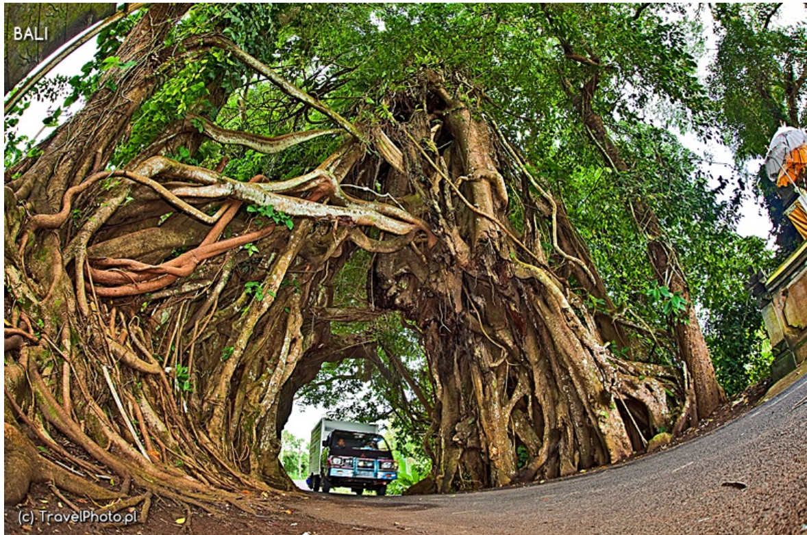
Wielkie, święte drzewo - brama.

Kierowcy składają ofiarę w stojących obok drzewa kapliczkach, a ci bardziej nowocześni robią sobie zdjęcie telefonem. Być może w tak wielkim drzewie faktycznie mieszkają potężne bóstwa opiekuńcze, lepiej zatem z nimi nie zadzierać! Na wszelki wypadek powstrzymuję chłopców przed wspinaczką, za to pozwalam im pobiegać w środku i sprawdzić, czy jest echo. Nie ma? To ruszajmy dalej!