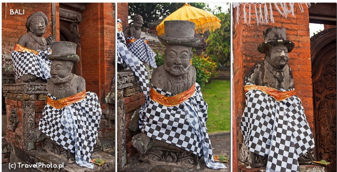
Demony w cylindrach.