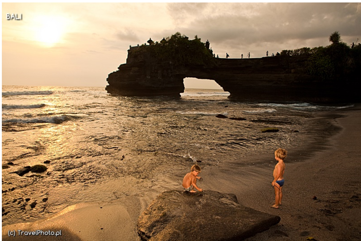
Na łuku skalnym wychodzącym w ocean świątynia Tanah Lot Batu Bolong.

Wyspa Bali jest tak bogata w ciekawe miejsca, tyle ich widzieliśmy, że trudno wszystko opisać. Dlatego na koniec dodajemy galerię zdjęć by pokazać jeszcze kilka niezwykłych miejsc.