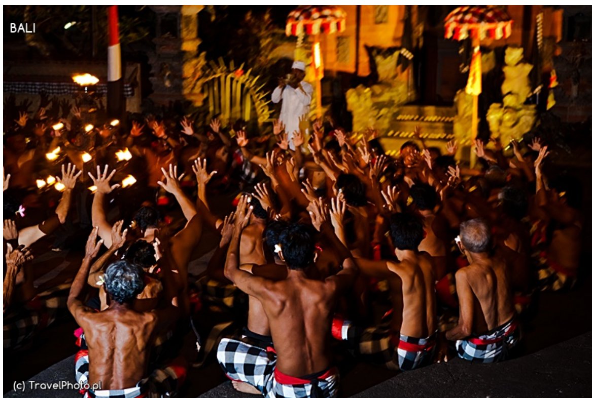
Układ tancerzy przez większą część tańca. W tle kapłan błogosławi.