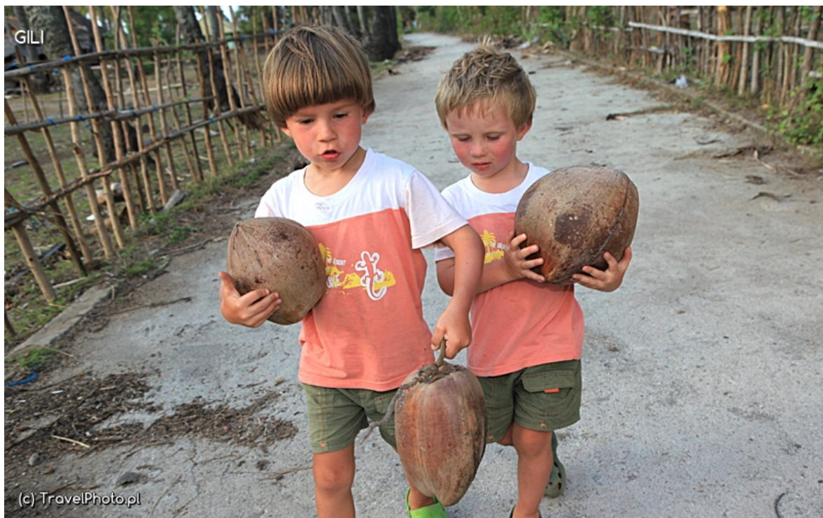
Kokos to nasz skarb.