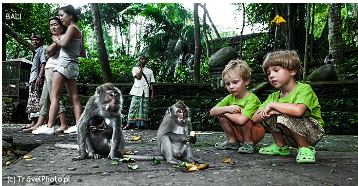
Ubud - Monkey Forest.

zalewa istny potop, na szczęście drzewo prawie nie przepuszcza deszczu. Kilkanaście minut i niebo znowu się rozjaśnia. Ostatnie krople błyszczą jeszcze przez chwilę niczym diamenty, z wolna unieściewane upałem. Skryte między drzewami kamienne warany odprowadzają nas obojętnym wzrokiem, gdy idziemy do świątyni Durgi. Bogini śmierci często jest przedstawiana pod postacią złowrogiej wdowy-wiedźmy Rangdy, zatem lepiej uwagę chłopców skierować na kamienne płaskorzeźby przedstawiające walkę stada małp ze złym wężem.