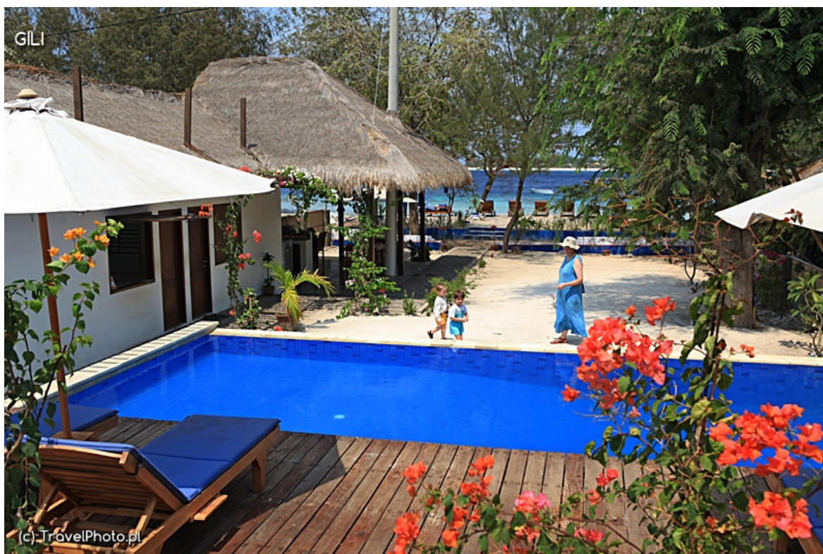
Nasz basen. Mały, ale ze słodką wodą! Na wyspie bez... wody!