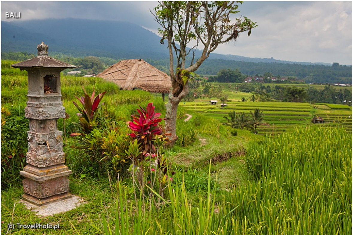
Krajobraz wnętrza wyspy.